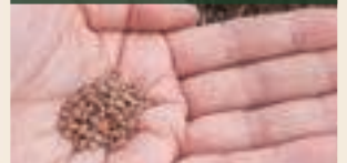
(大根、地這いきゅうりなど)