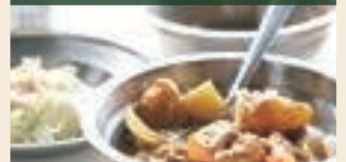
(学校給食提供、セミナーなど)