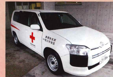
災害救護用自動車

また、市町への支援として発災時に避難所の状況確認やニーズを調整する職員派遣のための災害救護用自動車や、被災者へ迅速に救援物資をお届けするための救護用倉庫を更新します。