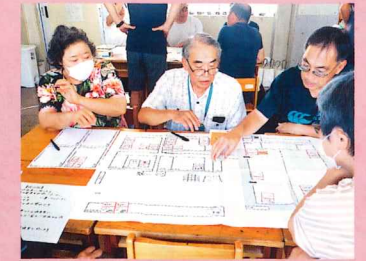
ひなんじょたいけんでのグループワーク

静岡県支部では、地域の防災力向上を支援するため、防災や減災に関する知識や技術を学べる「赤十字防災セミナー」を自治会等を中心に県内各地で開催します。