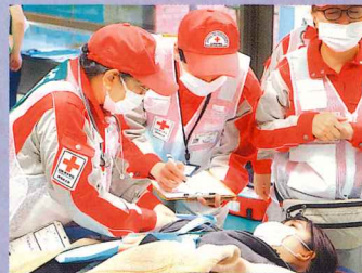
仮想傷病者の状態を確認する救護班