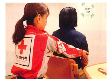
リラクゼーションを行うこころのケア要員

これらの活動は、皆様からのご支援により続けることができます。引き続き、赤十字活動資金にご協力をお願いいたします。