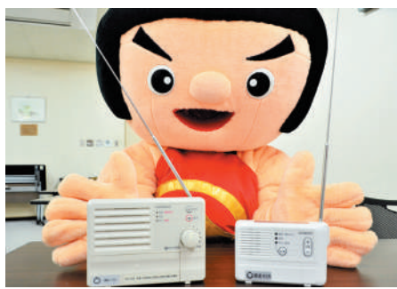
▲各戸に配布したデジタル戸別受信機。町からの貸与品です。大切に使ってね

地域によっては電波状況の良くない箇所があります。設置場所の変更行っても改善しない場合は、危機管理局（総合文化会館2階）までお問い合わせください。