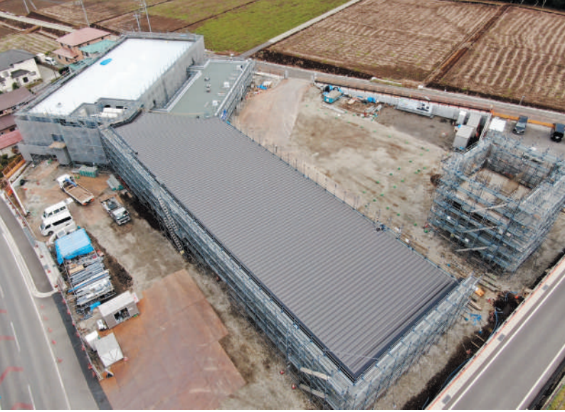
▲ 10月開所予定の建設中の小山消防署（棚頭）