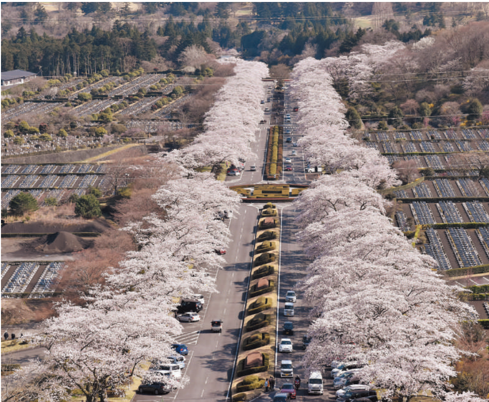
▲ 展望台から望むサクラ中央通り