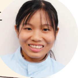
ミンガラバー မင်းဂလာပါ (こんにちは)