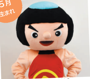
さかたのきんとき 金太郎 (坂田金時)