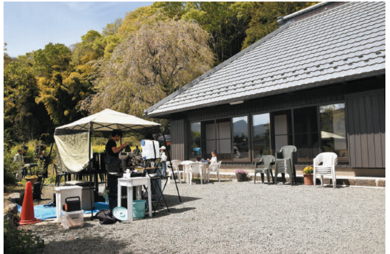
▲ 町内のコーヒー店も出店しました

NPO法人谷戸山倶楽部は4月18日、古民家春まつりを初開催しました。この日は天候に恵まれ、多くの親子連れが来場しました。「谷戸山のいえ」は、大正13年に建築、養蚕を営んでいた民家を改修した施設です。広さ30畳の土間と8畳3部屋、6畳2部屋を備える平屋造りで、地域の体験活動や文化振興を行うことを目的として、すがぬまこども園との交流事業や敬老ふれあい事業などを行っています。