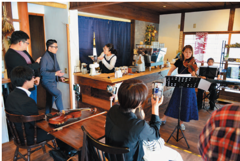
▲ コーヒーと生演奏を一緒に楽しめます

オレンジカフェは、認知症サポーターが運営する、認知症の人やその家族、福祉に関心がある人など誰でも参加ができる場所です。