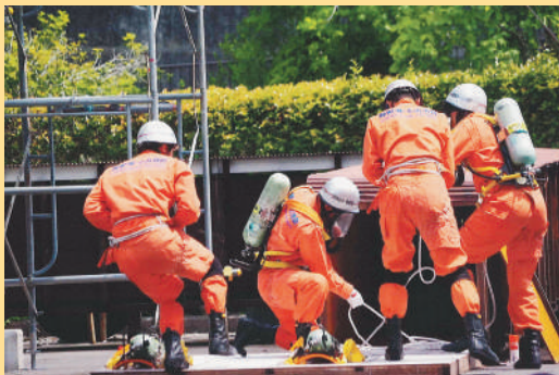
▲ 県大会に向けて、ただいま訓練中