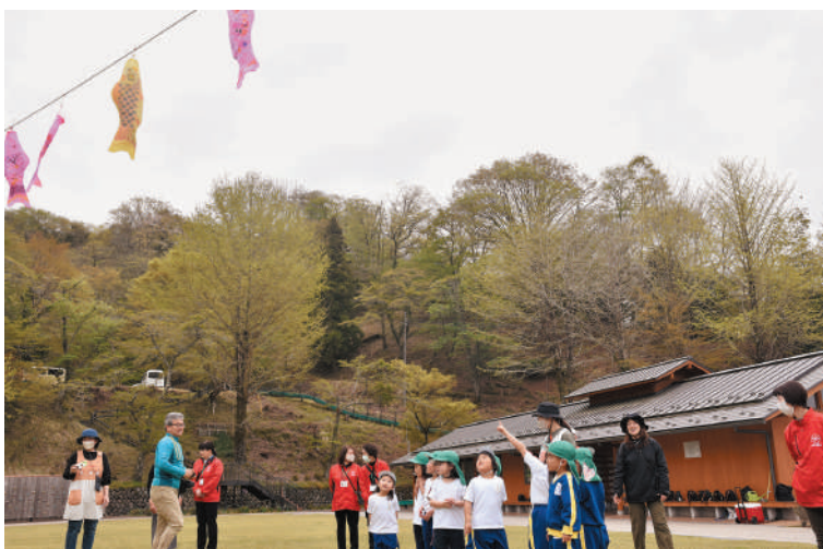
▲ 空高く揚がるこいのぼりに手を振る園児