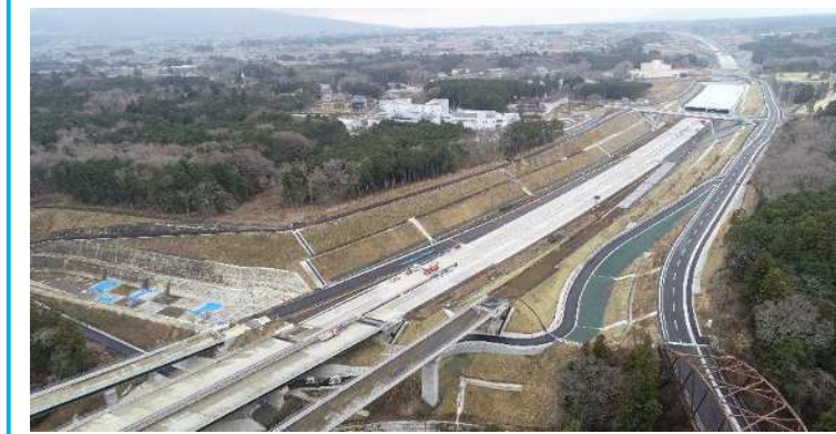
① 須川第一橋~用沢跨道橋