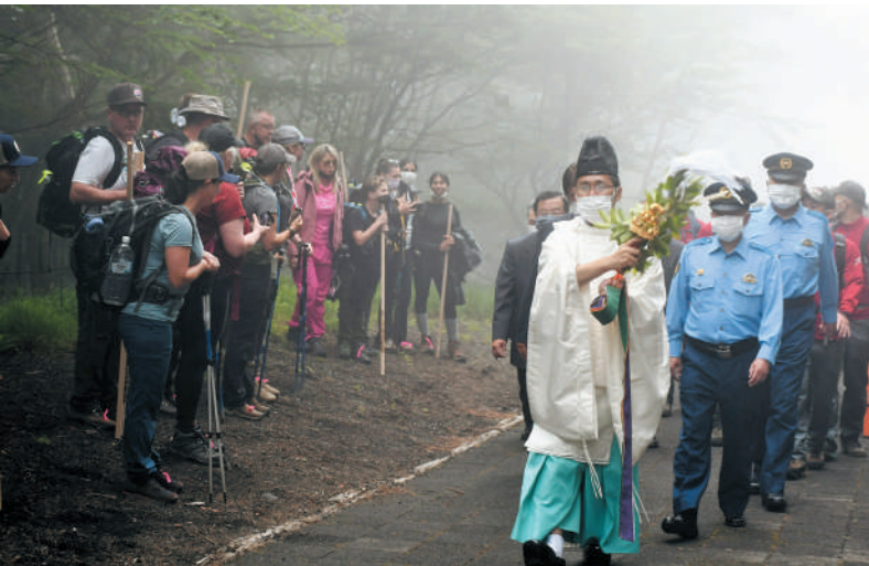
▲外国人観光客も厳かな雰囲気に興味をひかれていました