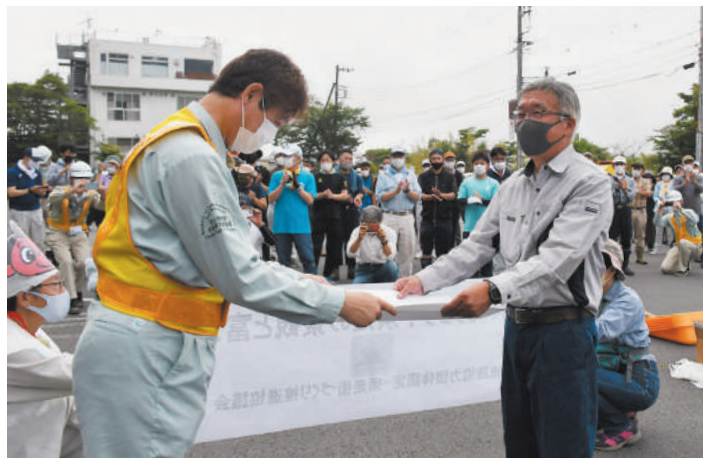
▲道路協力団体認定証を受け取る外川会長