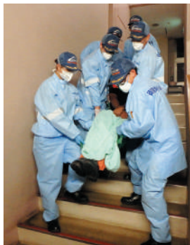
▲ 困難な現場でも力を合わせて