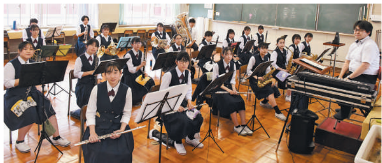
▲管セクションで練習する部員の皆さん

これからも私たちの演奏を聴いて、より多くの皆さんに元気をお届けできるよう努力してまいります。今後も応援のほど、よろしくお願い致します。