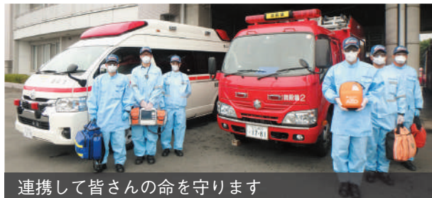
連携して皆さんの命を守ります