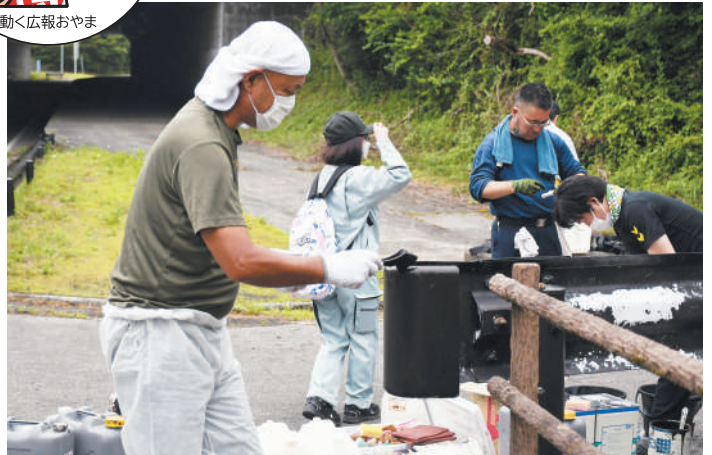
▲白いガードレールを景観に配慮した色に