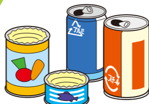
缶 (スチール・アルミ)