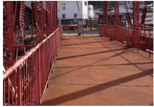
写真11 床版(1) 縞鋼板をデッキプレートとして裏面をFBのリップで補剛