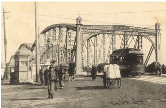
写真2 旧両国橋（明治37年、石川島造船製作）

森村橋と同形式のプラットラスで大型のもの。同じ工場でも2年前に製作された。3スパンのうち中央は関東断震災後に南高橋として現存