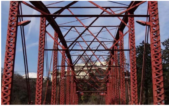
写真9 垂直材, 上横構 上横構は一部継手が腐食して垂れ下がっている