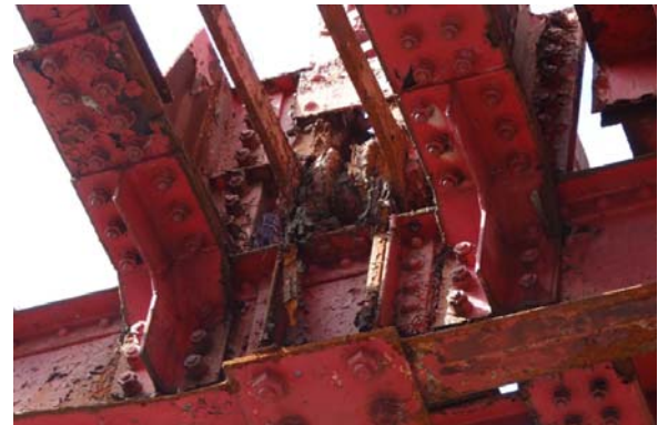
写真4 下弦材格点部(1)

斜材は途中からハの字形の斜材が追加された。下弦材は端パネルが溝型鋼2枚をレーシングバーで繋いだ閉断面でその他はが2枚のアイバーで、この外側に新規のH断面の下弦材を追加