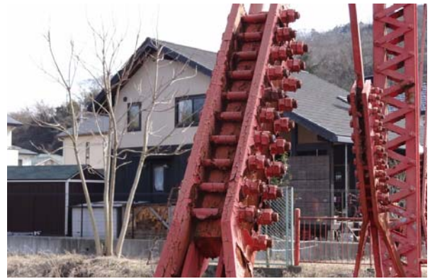
写真7 斜材の継手部

溝型鋼2枚をレーシングバーで繋いだオリジナルの下弦材は、格点付近で腐食によりほぼ切断状態となっている