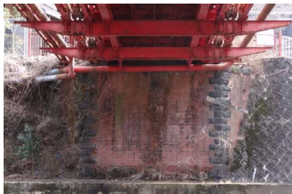
写真10 ブラケットと一体となった横桁 弦材の下側に取りつくブラケットと一体となった横桁 ブラケットには添加のパイプが載っている。レンガ、石造の橋台が背後に見える