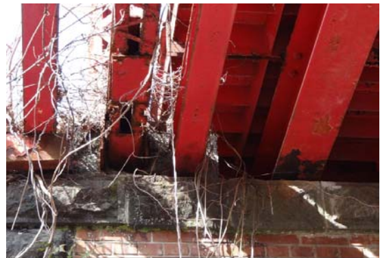
写真13 支点部付近 端横桁に接続する追加された下弦材, 縦桁は端横桁とともにコンクリートで覆われている

主構支点部は固定とローラ支承であるが、現況は下弦材の端部, 端横桁部分は、沓とともにコンクリー