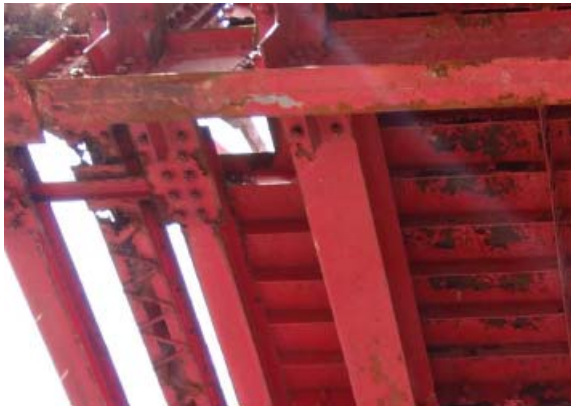
写真5 下弦材格点部(2)

溝型鋼2枚をレーシングバーで繋いだオリジナルの下弦材は、格点付近で腐食によりほぼ切断状態となっている