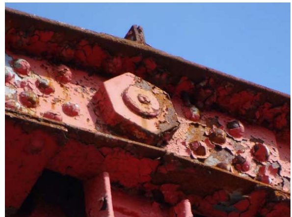
写真8 上弦材格点部

オリジナルの斜材は2枚または1枚の平板断面で、下弦材格点から長さ4/1附近で、この斜材をフィーラープレートを入れて2枚の板で挟みこみ、テンションボルトで締め付けることで摩擦によって斜材張力をピンを経ないで下弦材格点まで伝達するように部材を追加して