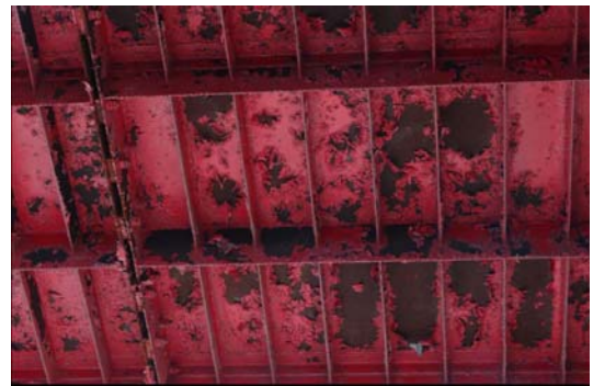
写真12 床版(2) 床版裏面のリップとパネル継手 (横方向が橋軸)