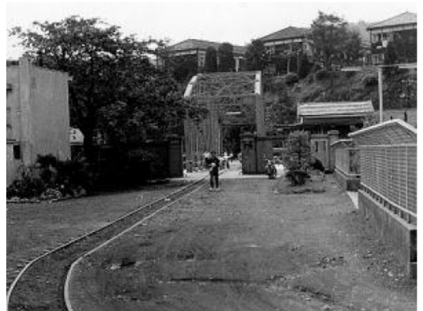
写真 15 旧工場入口の森村橋へ続く軌道 （昭和 42 年 6 月撮影 阿久津浩氏 小山町所蔵） 軌道は橋を渡りつつ左へカーブする上り勾配に入る。 昭和 30 年に機関車が前方左側（左岸上流側）の端柱に衝突してその後の修理で新規部材への交換を含めた補修が行われた