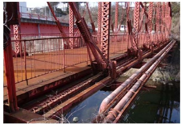
写真3 補強された斜材、下弦材

本橋は、供用半世紀後の1955(昭和30)年に、牽引機関車の端柱への接触により、端柱、橋門構、支承などの補修工事が行われた。すでに腐食や摩耗などによる老朽化も進んでいたようで、同時に格点のピンも一部取替えが行われている。施工は河川中に設置された仮受けのベントで桁を支持することで桁端を無応力状態とする大