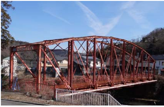
写真1 森村橋全景（鮎沢川左岸（工場内）上流側より） （撮影 2017年2月）