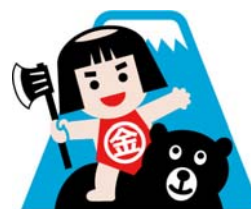
金太郎生誕の地 おやま