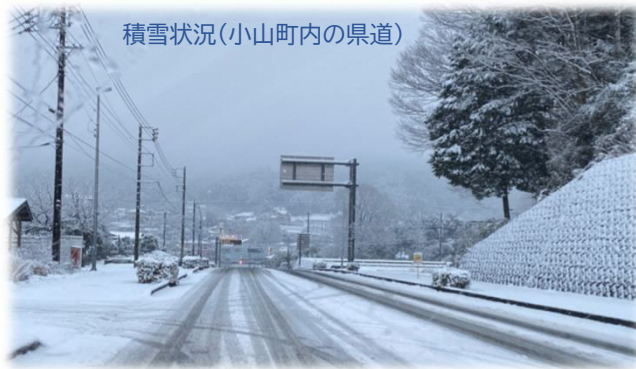
積雪状況(小山町内の県道)