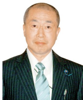
副議長 なほひこ なほひこ たかしま 鷹島 邦彦