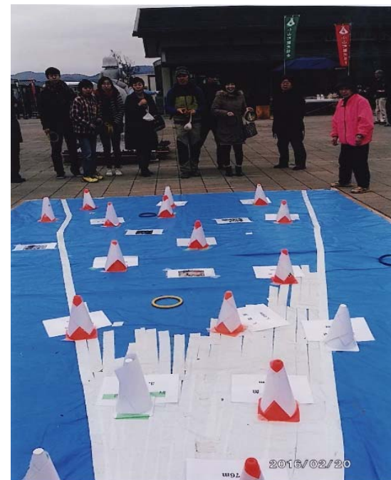
須走口富士登山輪投げ