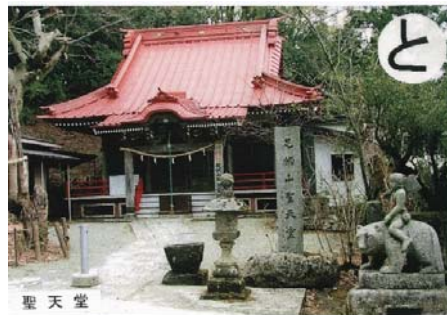
峠道 夫婦和合の聖天堂