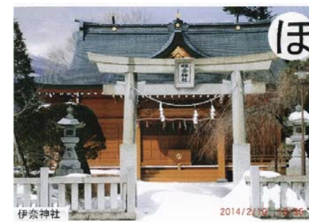
宝永の 噴火を語る 伊奈神社