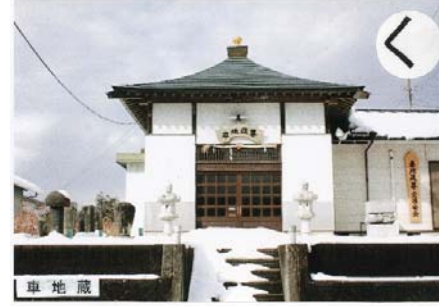
車地藏 交通安全 祈願の霊場