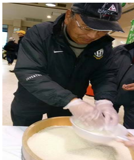
お米の掬い取り 最高720g