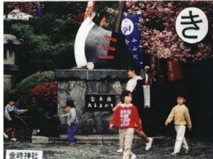
金太郎の生家跡とう 金時神社