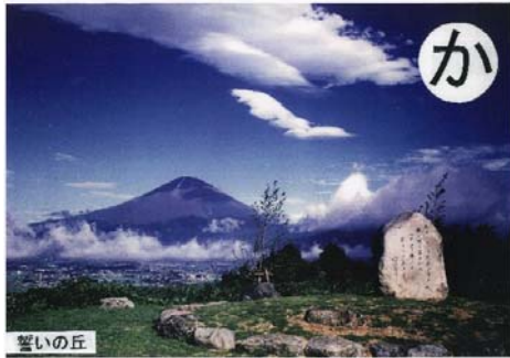
鐘の音に乗せて誓いを 立てる丘