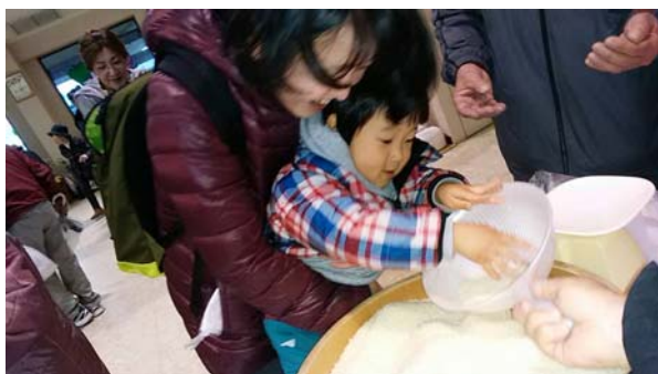
お米の掬い取り 子どもは5回挑戦！