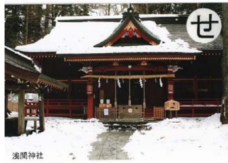
世界遺産 登録されし 浅間神社