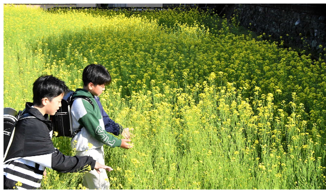
【写真】秘密の花園の様子（下谷）