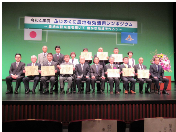
【写真】令和4年度ふじのくに農地有効活用シンポジウムにて小山町農業委員会が「優良賞」を受賞

この度、小山町農業委員会が実施した「秘密の花園作戦」が「優良賞」を受賞しました。