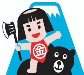
富士山頂と金太郎のまち おやま