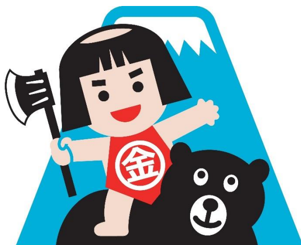
富士山頂と金太郎のまち おやま

～「富士山頂のあるまち」「金太郎生誕の地」にふさわしい 元気で、明るく、心豊かな人づくり～