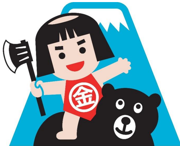
富士山頂と金太郎のまち おやま