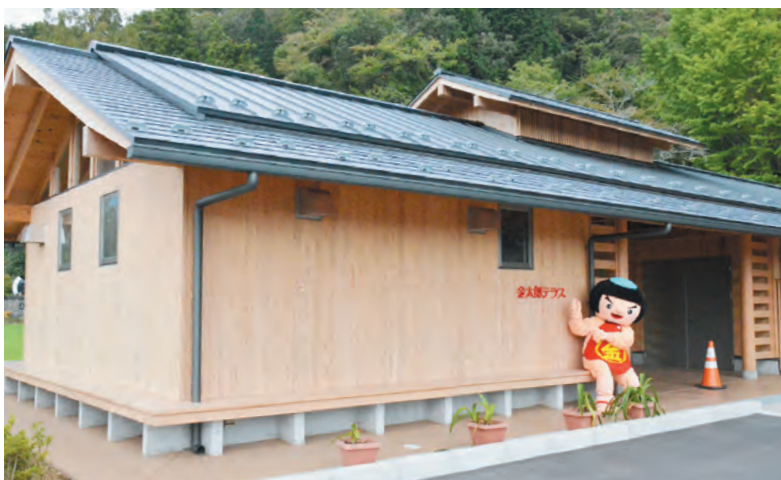
▲リニューアルした金時公園に新設。交流施設「金太郎テラス」