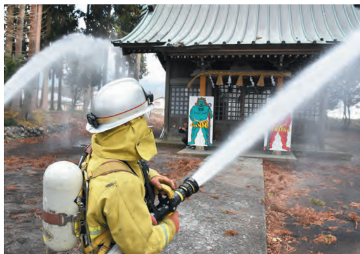
▲用沢八幡宮で放水をする小山消防署員