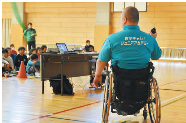
▲須走小学校で開催「あすチャレ! ジュニアアカデミー」

町では、東京2020オリンピック・パラリンピック開幕に向けて「オリンピック・パラリンピック推進局」を中心に、さまざまな事業を進めています。4月の開催地決定セレモニー、7月の庁内における推進本部の組織、12月には開催地支援協議会を立ち上げました。