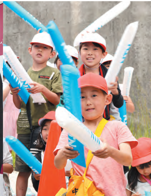
▲自転車ロードレースを間近で観戦（TOJ富士）