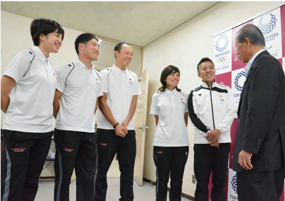
▲東京2020でメダルを目指す日本パラサイクリング連盟強化指定選手の表敬訪問