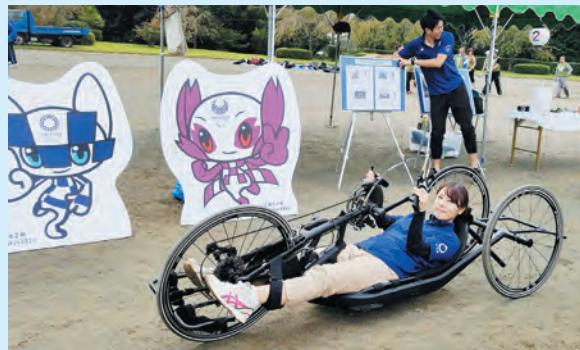
▲パラサイクリングを試してね!

オールおやまで盛り上げたい！ 東京2020オリンピック・パラリンピック 5000日前イベント in 小山