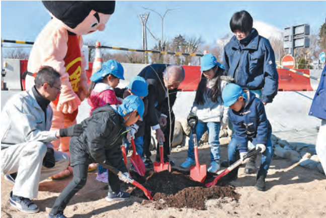
▲園児と込山町長が協力して「ふじ桜」を植えました