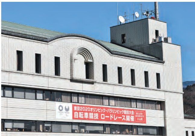
▲役場本庁舎に掲出された祝いの横断幕

国際オリンピック委員会は平成30年2月3日、小山町にある富士スピードウェイを東京2020オリンピックの自転車競技ロードレースのゴールとタイムトライアル会場として承認しました。