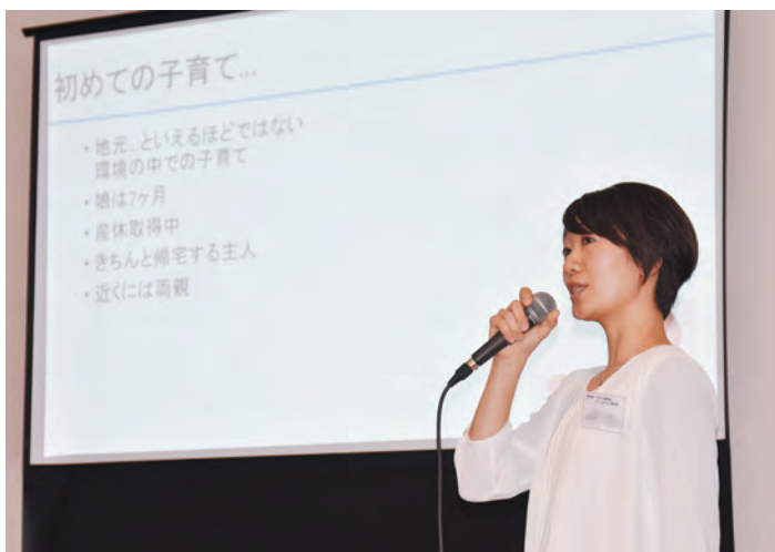
▲おやまを魅力的に! 熱いプレゼンテーションがされました