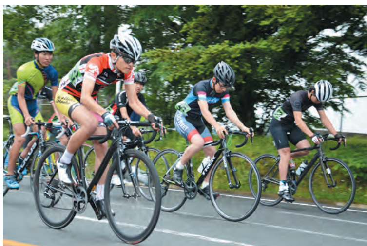
▲ふじあざみラインで開催される自転車ロードレース

ループなどが共同で展開する大型観光企画（ディステイネーションキャンペーン）を実施して、多くの観光客を誘致し、継続的な集客につなげていきます。