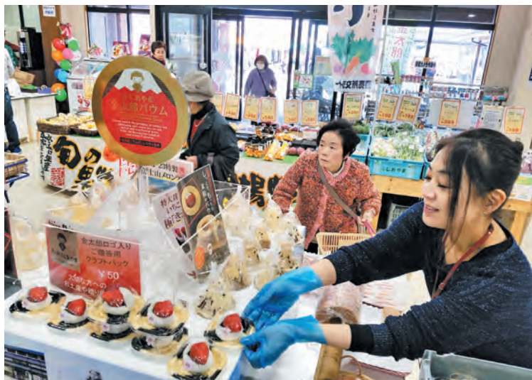
▲100個限定販売のおいしいいちご大福!

富士山をかたどった特製メロンパンや用沢産のイチゴを使ったいちご大福、季節限定の「金太郎いちごバウム」の試食・販売などのほか、観光案内ボランティア「四季の旅人」による富士山や町内観光スポットの写真展、クイズ大会が行われ、会場は大いに盛り上がりました。