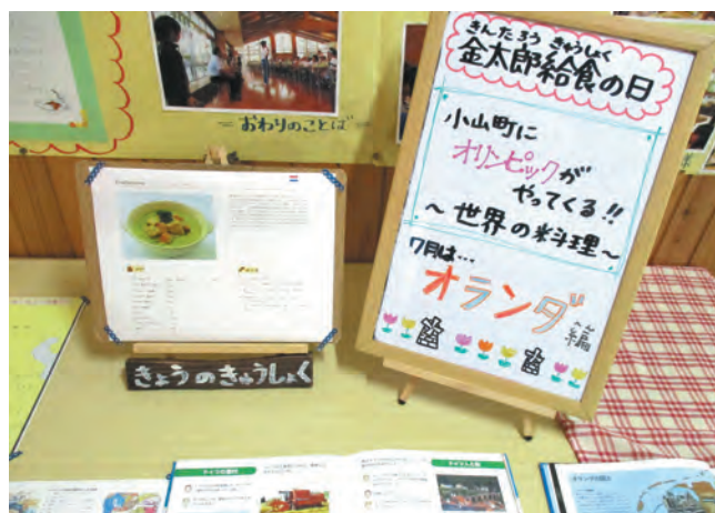
▲須走小学校での金太郎給食。この日はオランダ料理！

を決めて「金太郎給食の日」を設けています。今年度は「自転車ロードレースの盛んな国を知ろう」をテーマに、フランス、オランダなどの料理が献立に取り入れられました。来年度のテーマは「お・も・て・な・し」。オリンピック選手が小山町の給食を食べきたら…を想定して、中学生が「食育」の授業で地場産品を使ったおもてなしメニューを考えます。東京2020オリンピック・パラリンピックを「おやまの給食」からも盛り上げていきます。