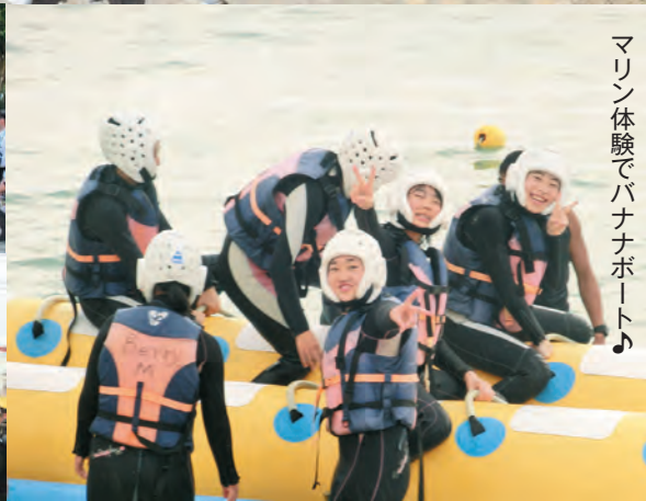
マリン体験でバナナボート♪