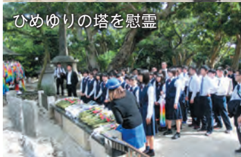
ひめゆりの塔を慰霊