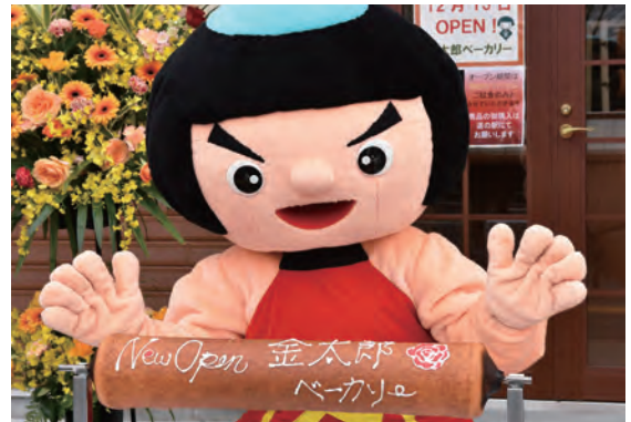
▲おいらの名前がついたおいしいバウムクーヘン！

道の駅ふじおやまは、平成29年度にレストランや厨房などをリニューアルしました。観光ツアーの団体客、外国人観光客などを受け入れて、おやま産の農産物を提供しています。今年度は、地場産の米やもち米を活用するために、道の駅隣りにある「ふじあざみ（農村活性化センター）」に、お菓子の製造室を整備して、種類や数量の大幅な増加を図っていきます。金太郎バウムは、ふじあざみにオープンした「金太郎ベーカリー」の専用オーブンで焼き上げられます。おやまの新しい「おみやげ」を、道の駅から全国に発信します。