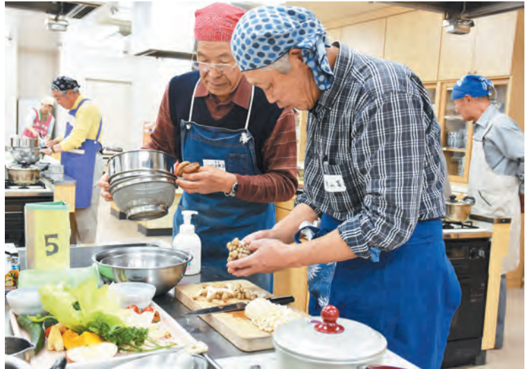
▲できる男は、料理もお上手です

町は12月7日、今年度3回目となる「男の料理教室」を健康福社会館で開催しました。今回は、ポークソテー、かぼちゃのスープ、枝豆ライス、レタスとリンゴのサラダの洋食メニュー。参加した15人の男性は、5班に分かれて調理に取り組みました。包丁使いが慣れている人、おそろおそろ野菜を切る人などさまざまでしたが、班ごとに協力をして、カボチャを切ったり、豚肉を焼いたり。おいしそうな洋食ができて上がりました。