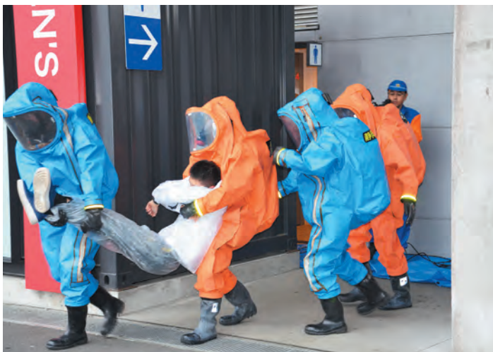
▲化学防護服を着用した県警機動隊員による搬送