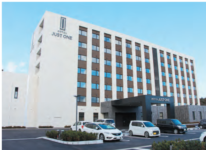
▲地上7階、162室、290人収容できるホテル

足柄地区にホテルジャストワン富士小山が12月22日、オープンしました。ホテルはビジネスホテル