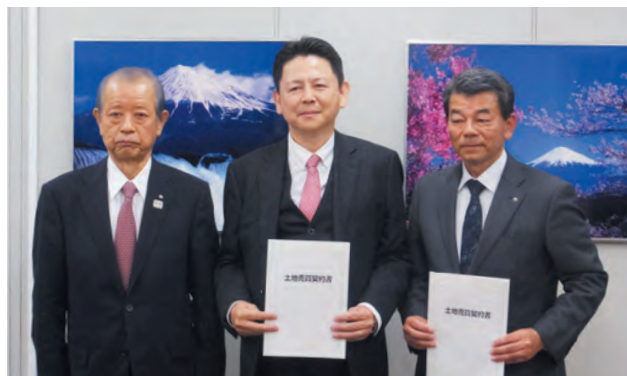
▲県と（株）アクシージアとの売買契約締結

静岡県と（株）アクシージアは11月30日、町が共同で企業誘致をしている「富士山麓フロントティアパーク 小山」区画1（面積1.13 ha）について、土地売買契約を締結しました。富士山麓フロントティアパーク 小山では、シンコー技研（株）やまみに続き、3社目の契約と