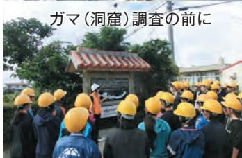
ガマ(洞窟)調査の前に