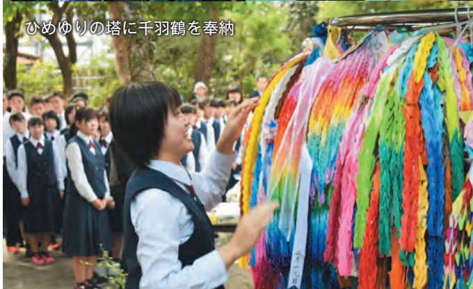
ひめゆりの塔に千羽鶴を奉納