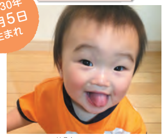
花塚 はると 陽斗ちゃん(下原)