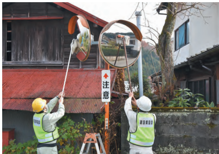
▲カーブミラーを磨きあげる建設業協会会員