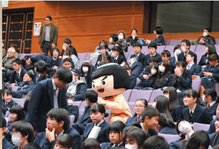
▲小山高生におやまの「まちづくり」を聞いてもらいました！