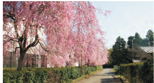
▲生涯学習センター弓道場前のサクラ

総合文化会館は、いろいろな趣味教室などで、 ご利用いただいています。手芸であつたり、民 踊、ダンス、バレエに和太鼓などなど…。どの 教室も長く続いています。打ち込める何かがあ るのは、うらやましいかぎりです。まず一步、 総合文化会館の新規教室に参加してみませんか。 4月の初め、会館周辺はしだれ桜に包まれます。 会館と同じ時を刻んで、多少渋みを増していま す。桜共々、皆さんをお待ちしております！