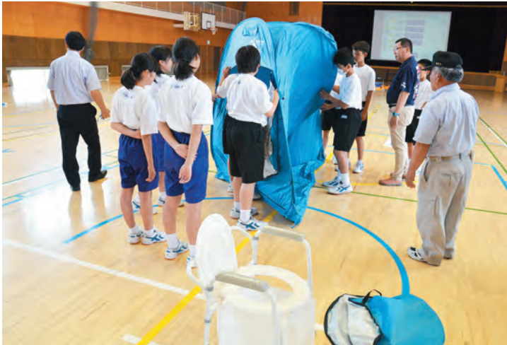
▲避難所で使用する簡易トイレを組み立て中 (防災資機材整備事業)