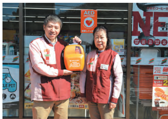
▲AEDを設置したセブンイレブン駿東小山店