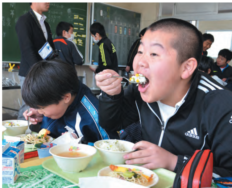
▲「おいしい！」みんなでおかわりもたくさんしました