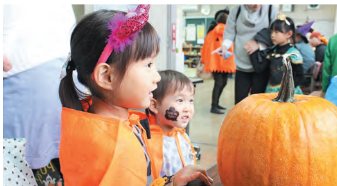
▲足柄地域金太郎計画推進協議会によるリアルハロウィン (金太郎計画2020事業)