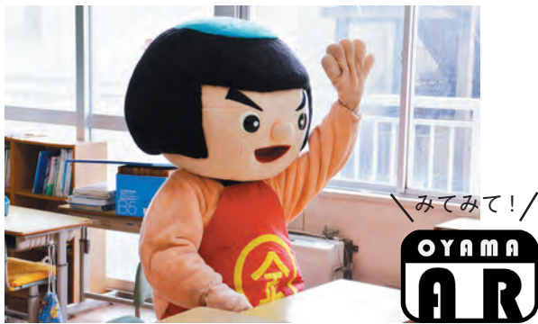
▲おいらもワクワク、ドキドキ

希望と期待に胸を膨らませていくことは、子 どもたちの成長にとって欠かせないことです。 子どもたちに「今年こそ」と目標を持たせ、目 標が形となるよう支援したり、金太郎十か条を 実行できるよう応援したりしていきましょう。