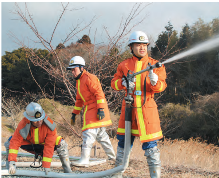
▲林野火災を想定しての放水訓練