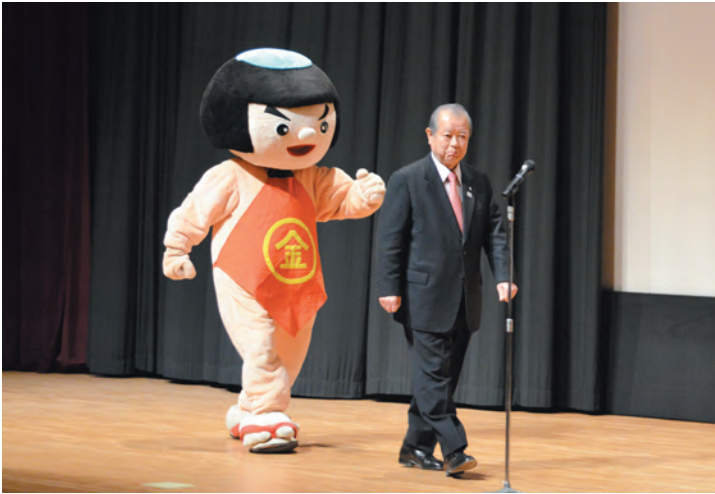
▲開会のあいさつ。込山町長に続いて金太郎も壇上へ