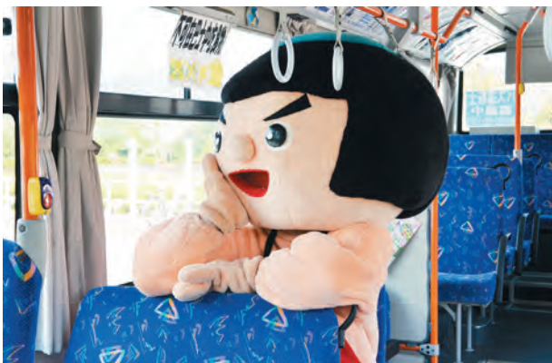
▲バスに乗るのもいいものだけい…(地域公共交通活性化事業)