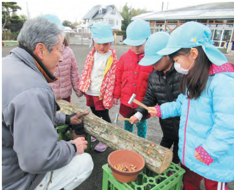
▲みんなで打ったシイタケの菌。食べるのが楽しみ！

園庭には、ナラやクヌギの木が20本程用意され、ドリルで穴を空けたあと、年中児44人が交代でシイタケの菌を打ち込みました。カナヅチを使っておそろおそろ菌を打ったり、思い切り打ちつけたり、作業はさまざまでした。今後園児は、シイタケが大きくなるまでを観察し、収穫した後は給食で食べることになっています。