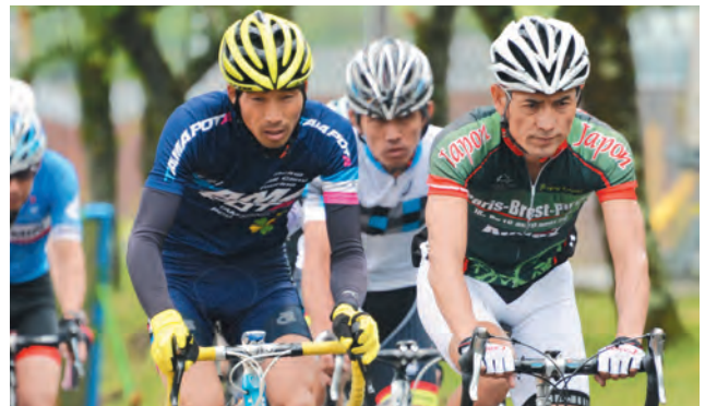
▲観光資源「富士山」を活用しての自転車レース (観光地域づくり推進業務)