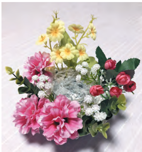
▲お母さんにプレゼントしよう