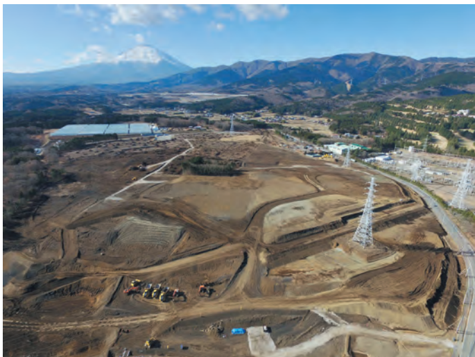
▲造成中の工業団地（新産業集積エリア）

湯船原地区に誕生する新たな工業団地は3つ、合計で116ヘクタールに及びます。その中で、静