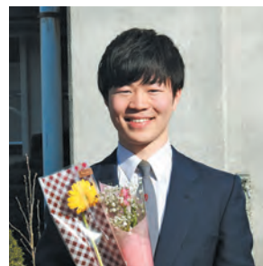
平成29年度卒業生 前期生徒会長

「卒業証書授与式」 小山高校は3月1日、卒業証書授与式を行いました。3年生は高校生活の思い出を胸に新しい世界へと立ち立ちます。小山町で3年間過ごした皆さんのこれからが、ますます「きらめき」ますように！