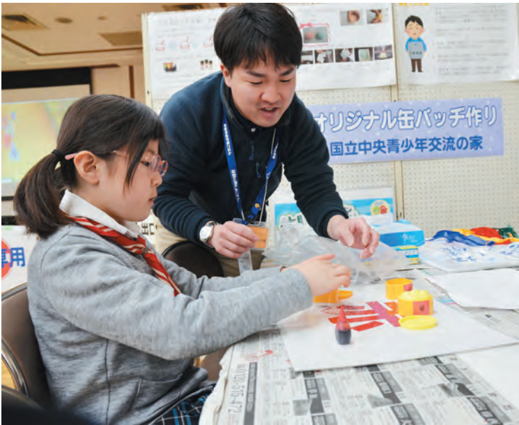
▲オリジナル缶バッジを作るよ

来場者は、工作や陶芸、ダンスなどさまざまな体験や、福祉施設や各種団体、家庭教育学級などの展示を楽しみました。