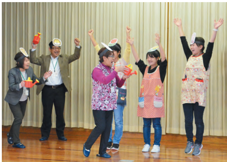
▲人権擁護委員の皆さん、駿河小山幼稚園の先生たちの寸劇

この教室は、深刻な社会問題となっている虐待やいじめなどを踏まえて、子どもたちを健全に育成することをサポートする目的で、町内の園、学校など5カ所で開かれます。園児らは、人権擁護委員や幼稚園の先生たちによる寸劇やゲーム、クイズなどで楽しみながら、友だちと仲よくすること、いじめないこと、思いやりの心を持つことなどを学びました。