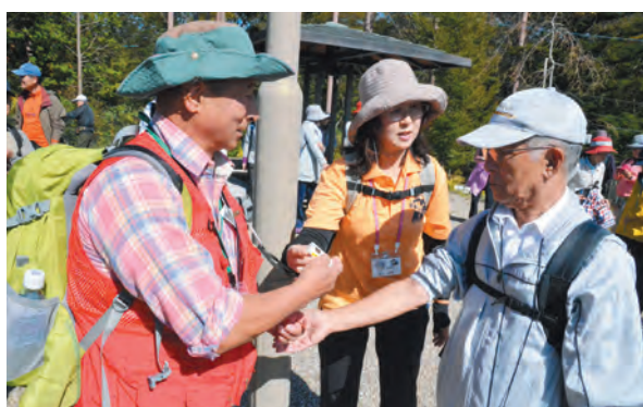
▲がんばらないウォーキングでお達者度向上！

10月21日には、クアの道認定記念健康ウォーキングを須走地区で開催しました。須走コミセンにおいて「クアの道」認定式と実践指導者5人に認定証、普及員15人に