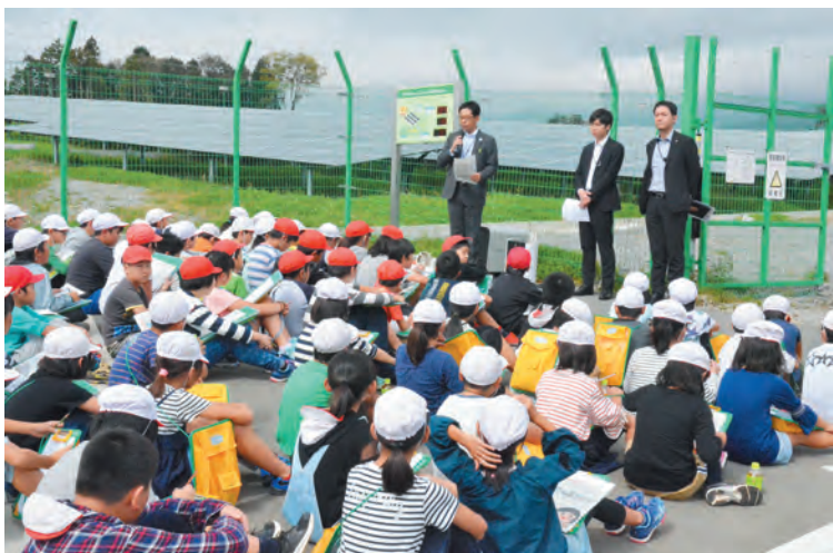
▲足柄小と須走小児童が太陽光発電について学びました（10月11日）

町と「湯船原地区太陽光発電事業地権者協議会」は10月11日と18日、町内の小学4年生（112人）を対象に『DREAM Solar ふじおやま』と『森の金太郎発電所』（木質バイオマス発電所）で、環境学習を行いました。 児童は、太陽光発電の事業者である「大和リース(株)」から地球温暖化や太陽光発電のしくみ、DREAM Solar ふじおやまが災害時に活用できることなどの説明を受け、再生可能エネルギーへの理解を深めました。 町では今後も、太陽光発電、木質バイオマス発電などの再生可能エネルギー活用の重要性を子どもたちに知ってもらうために、関係団体や事業者と協力して、環境学習を行っていきます。