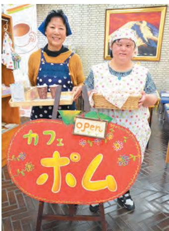
▲お待ちしております！