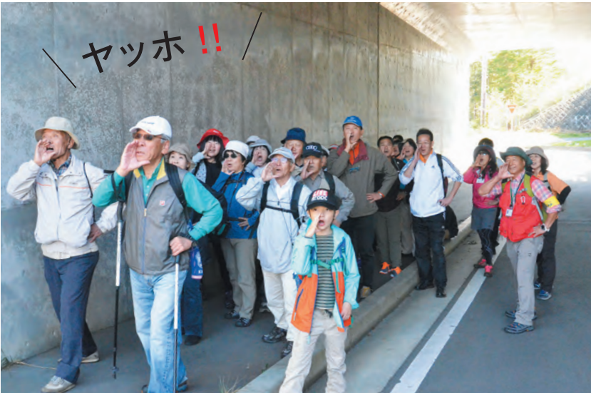
▲上りの途中で浅くなった呼吸を「ヤッホ」で入れ替えます

町は、町民の皆さんの健康寿命を延ばすために、平成27年度から4つの「お達者度向上プロジェクト」を展開しています。