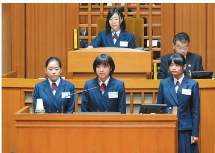
▲おやまのまちづくりに小山高生が堂々と意見！