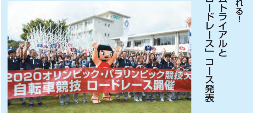
▲喜ぶ(株)ジーシー富士小山工場の皆さんと金太郎

町民体育大会のオリパラブースに、こんな自転車が登場! これは下肢の障がいにより、脚でペダルをこぐことが難しい選手が使用する「ハンドバイク」という自転車です。身体を寝かせた状態で、手でペダルをこぎます。(10月8日撮影 多目的広場)