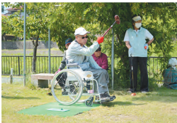
▲御殿場市身体障害者福祉会とパークゴルフで交流