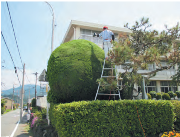
▲校庭の植木せんていを（校庭整備）