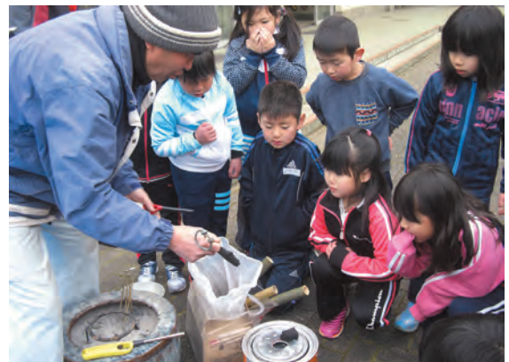
▲竹炭を作っているところ（学習支援）