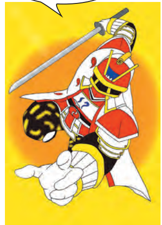
▲ヒーローイメージデザイン