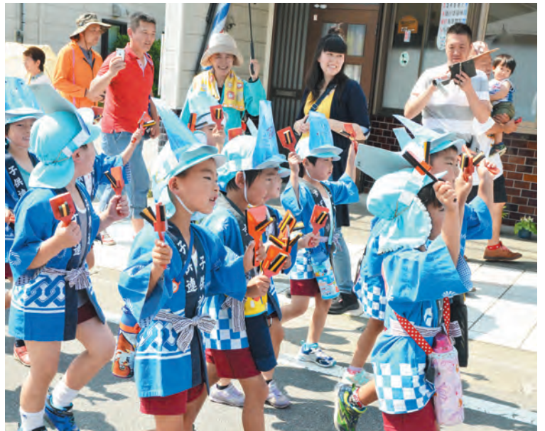
▲須走幼稚園児は、手作りの富士山をかぶってパレード

これは富士登山の安全を祈願するもので、富士山東口本宮富士浅間神社の社殿で、式典が執り行われました。式典を前に須走本通りでは、須走小6年生による金管バンドの演奏を先頭に、須走地区の幼稚園、保育園、小学生による神輿やよさこい、お囃子と続き、白装束姿の須走旅館組合による富士講などが開山を祝うパレードを行いました。