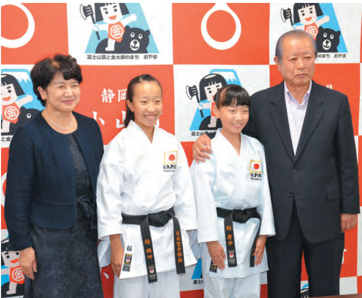
▲稲姉妹と込山町長、天野教育長

2人は「プレッシャーに負けず、小山町のために頑張りたい。」と報告。町長からは「この小さな町から姉妹で世界大会に出場するのは、とても名誉なこと。町民すべてが応援しているので頑張ってほしい。」と激励しました。