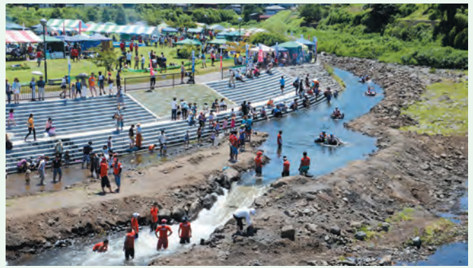
▲夏まつり恒例「おやまDEどんぶらこ」もきれいな水環境があってこそ

夏も真っ盛り! おやまの皆さん、いかがお過ごしですか? 相棒のクマが連日の暑さでバテ気味のため、またがるわけにもいかず、おいらは自転車乗りに挑戦! 補助輪なしで乗れたぜ~い♪ (7月18日撮影)