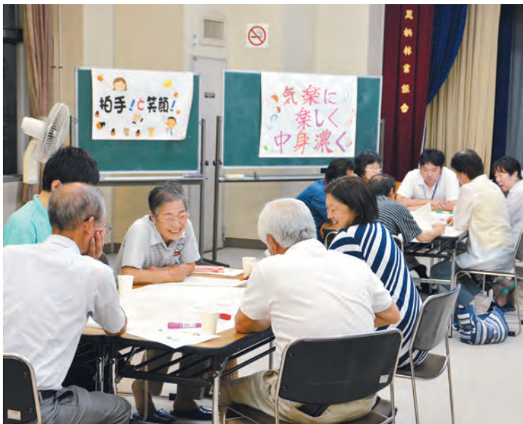
▲あしがらを歩いて健康に！