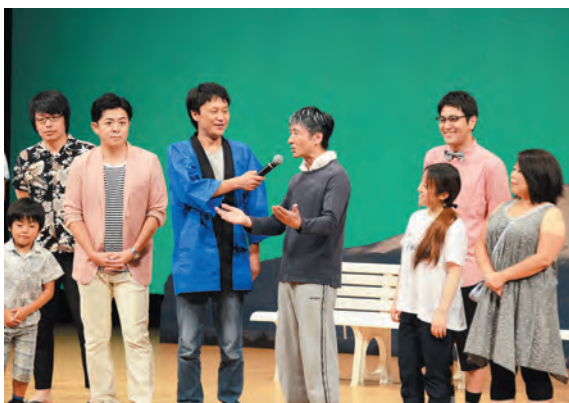
▲大変盛り上がった昨年度の公演の様子