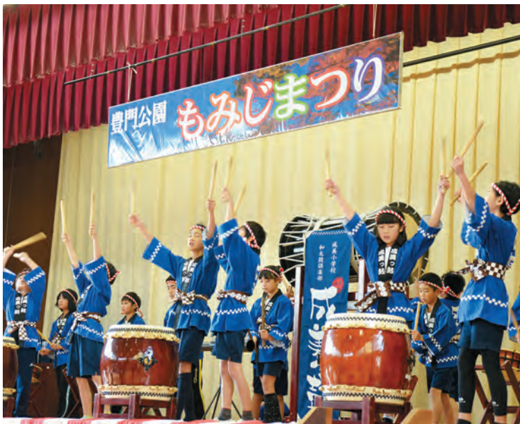
▲成美小5年生による勇ましい太鼓演奏