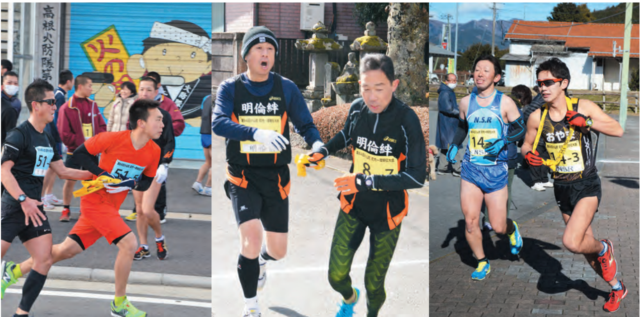
▲昨年度の町内一周駅伝大会出場チーム力走の様子