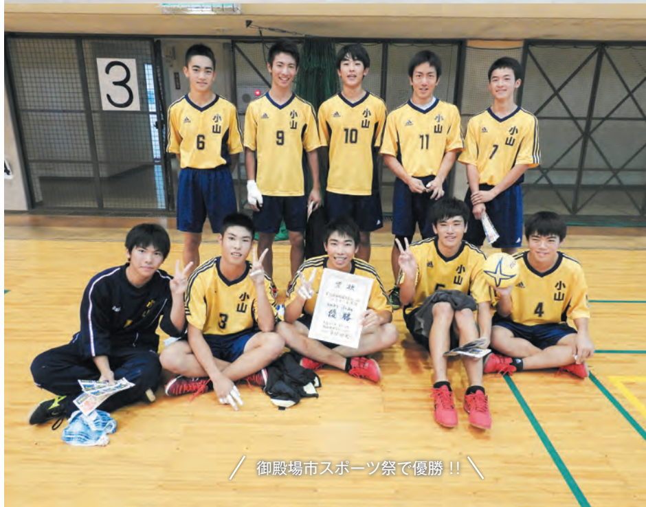
／ 御殿場市スポーツ祭で優勝！！ ／