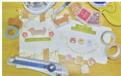
▲自分のはんこを作ってみよう