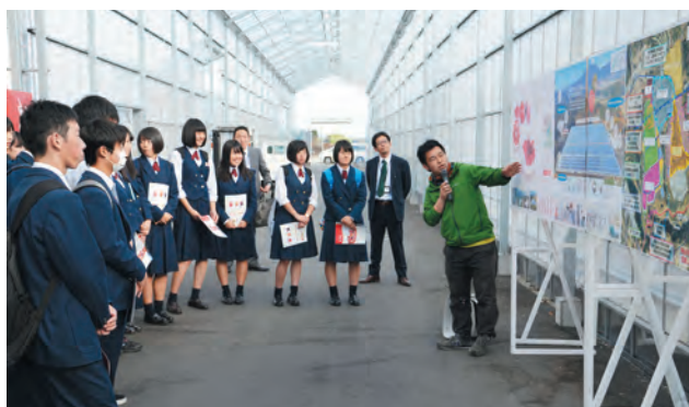
▲次世代施設園芸の見学をする小山高校生（上野）

地元の若者に魅力を感じてもら い、地元で働き、地元に住み続け てくれることを期待します。