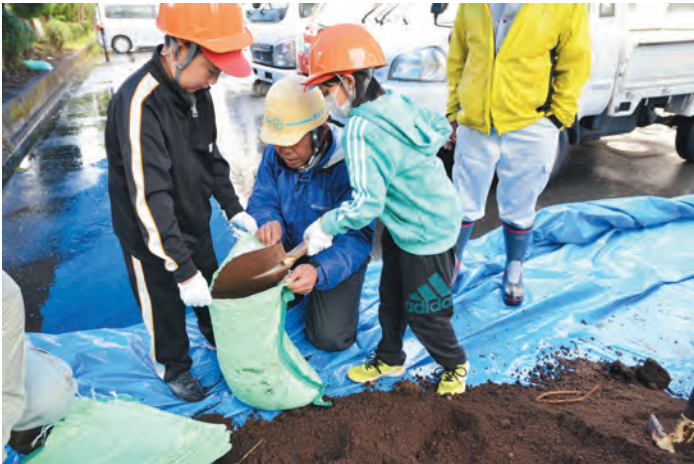
▲治山セミナーで須走小児童に土のう作りを指導（愛ネットおやま）

近年、公共サービスや地域の課題解決などについて、住民ニーズは、多様化・複雑化しています。