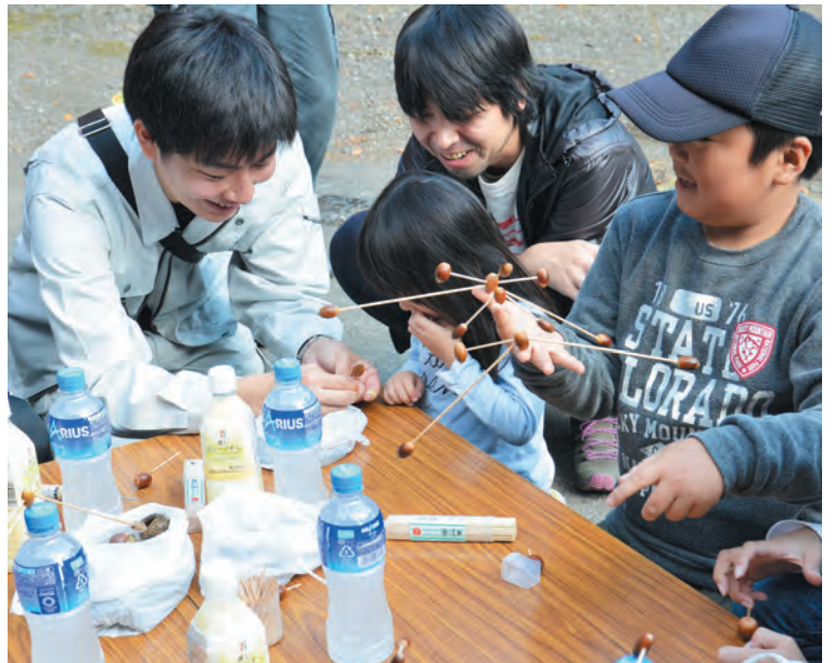
▲拾ってきたドングリでヤジロベエを作ったよ

明倫地域金太郎計画推進協議会は11月5日、恒例の谷戸山ハイキングを開催しました。これは、明倫地域の里山の風景を楽しみ、歴史・文化を学ぶイベントで、参加者は明倫小学校を出発して、道祖神や神社、文化財などの説明を聞いたり、ドングリを拾ったり、秋の谷戸山を2時間程かけて歩きました。ハイキング終了後は、ゴールの菅坂公民館で焼き芋ととん汁がお待ちかね。地元産野菜がたくさん入ったとん汁は、シニアクラブの皆さんの手作りです。