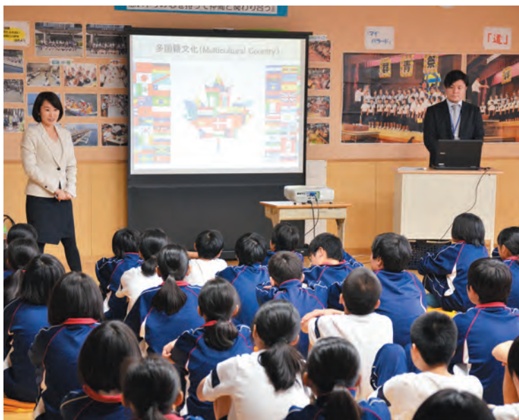
▲町内3中学校、小山高校で授業を行いました