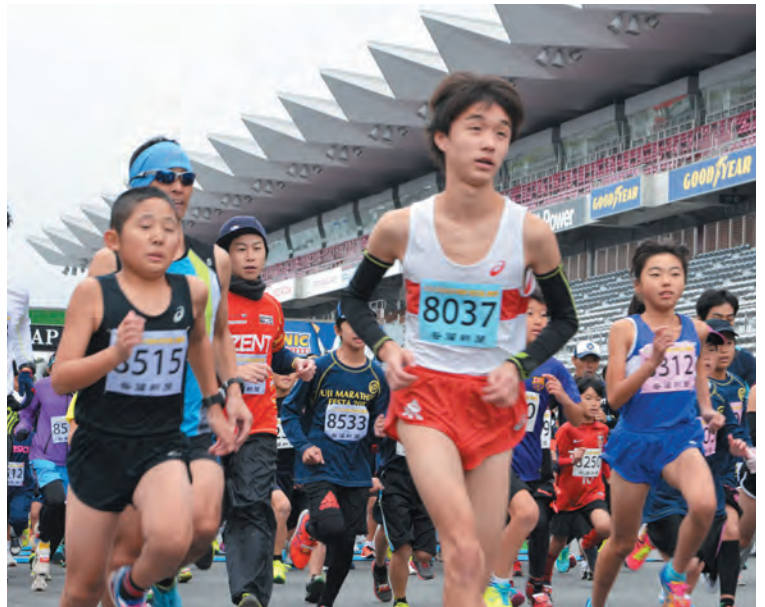
▲小・中学生部門が一斉にスタート！

富士マラソンフェスタ2017が11月18日、富士スピードウェイで開催されました。今回で40回目を迎えたこの大会は、国際サーキットのレーシングコースを走れる国内でも珍しいレースです。富士スピードウェイの施設を利用できるため、都市圏からのリピーターが多く、手作りとん汁の配布や地元のお土産販売などのおもてなしも好評です。あいにくの曇り空でしたが、約2,300人のランナーが参加して、広々としたコースでの走りを楽しみました。