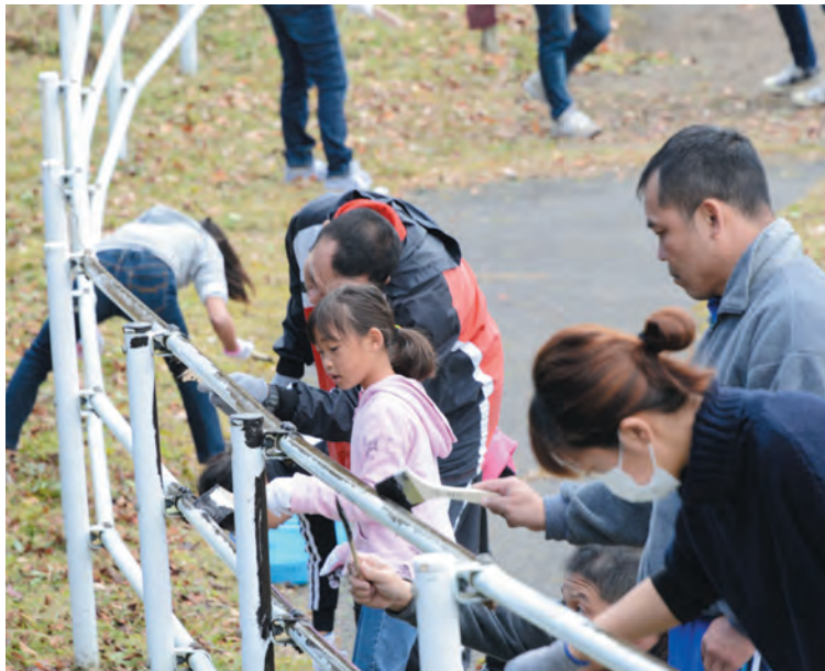
▲富士山に似合うガードレールの色に仕上げます