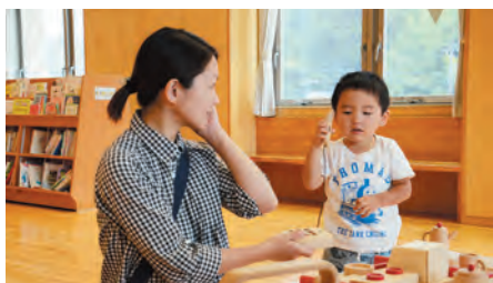
▲「もしもしママ？」「聞こえてるよ！」

いつまでも、こどもの不思議と一緒に考え、つきあえる大人でいたいなと思う、今日このごろです。