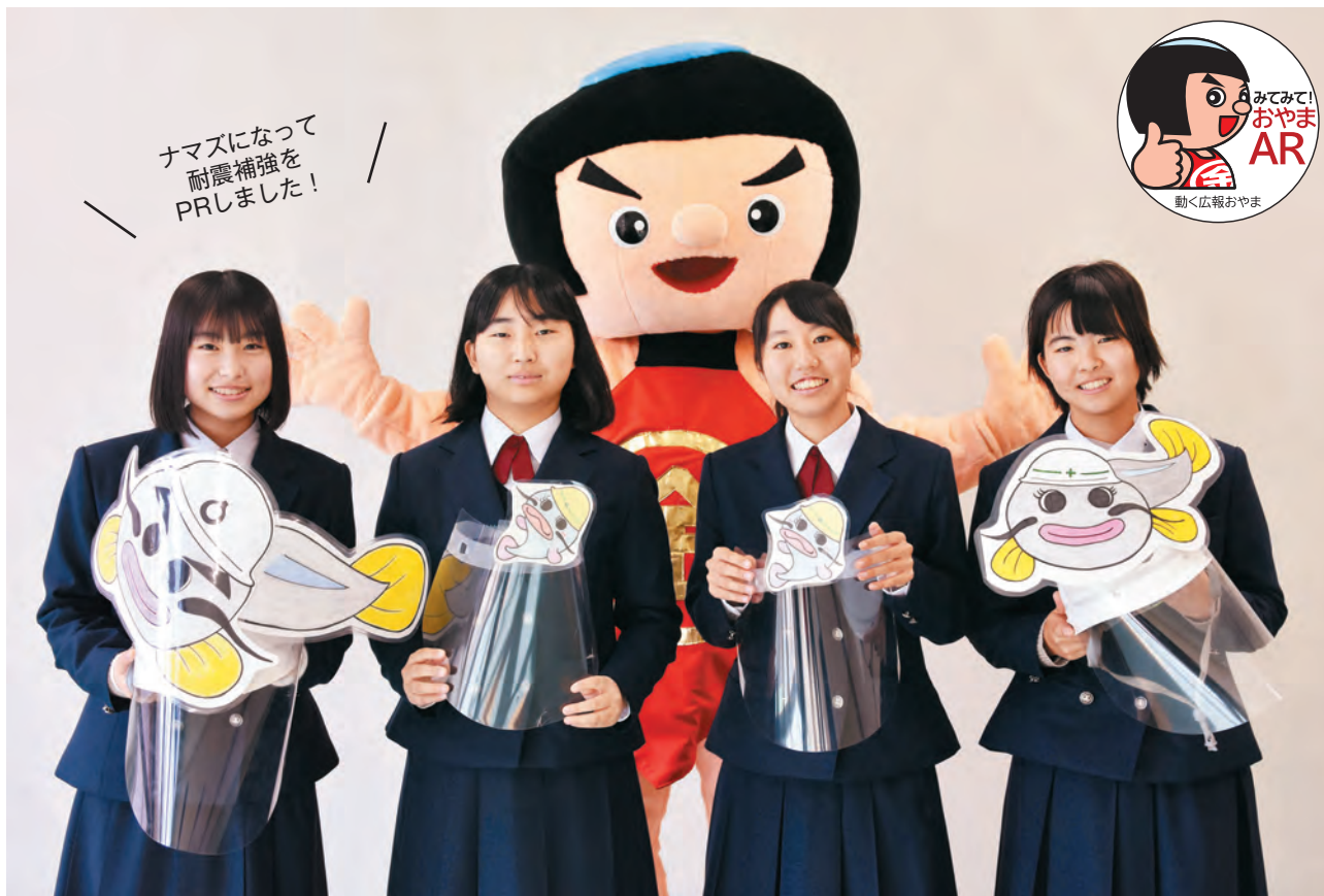
▲「活き活き健脳教室」で高齢者を対象に、耐震補強の大切さを伝える寸劇に挑戦（都市整備課）

町は、11月30日から12月4日までの5日間、町内唯一の高校である小山高校の1年生（124人）全員をインターシップ（職場で働く体験）として受け入れました。