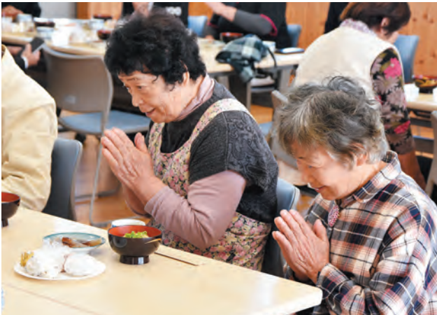
▲季節の野菜がたくさん献立をいただきます