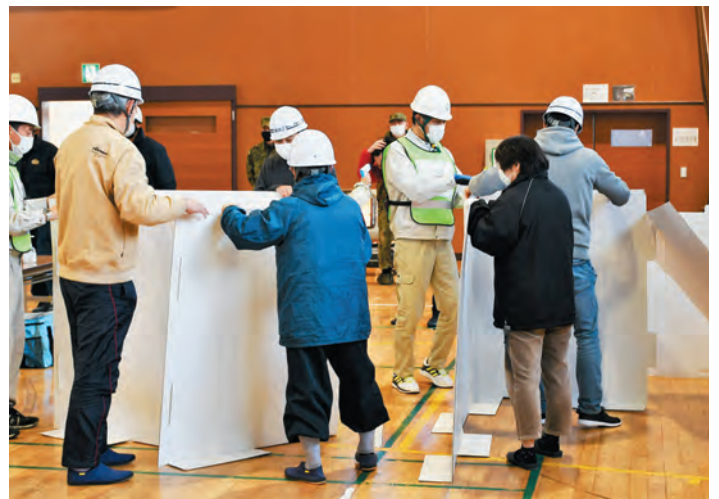
▲密を避けるために間仕切りシートを設置

成美小学校体育館では、自衛隊、警察署、富士健康福祉センターなどの協力の下、中島、藤曲、湯船、柳島区の合同訓練を行いました。コロナ下での避難所運営を想定して、通路用のブルーシートの設置、間仕切り段ボールの組み立てや受付などを行い、参加者は日ごろの備えの大切さを認識しました。