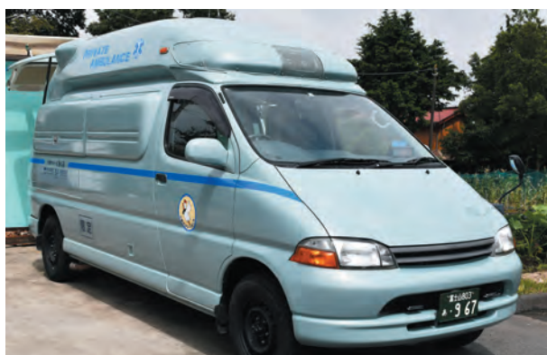
▲介護タクシーくるくるの搬送用車両