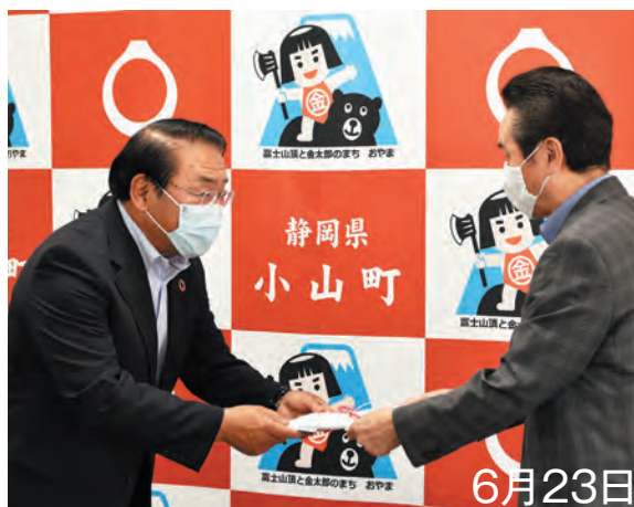
▲臼幸産業(株)から500万円の寄附を受けました