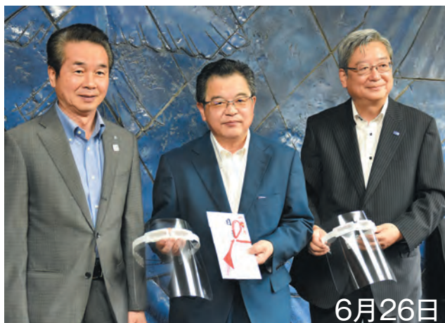
▲シモンズ(株)からフェイスシールド2,500枚の寄附を受けました

(株)アールビーズは、ランニング専門誌の発行や大会エントリーのポータルサイト運営、また、富士マラソンフェスタなどの大型マラソン大会の運営サポートなどを行っています。今後は、インターネットサイト「スポーツタウン小山」の開設や、ウォーキングアプリの導入などで町と連携していきます。