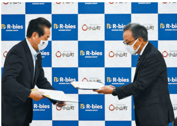
▲協定を交わした池谷町長(左)と橋本社長(右)