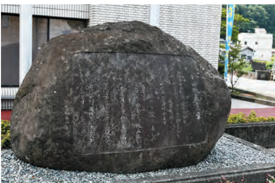
▲役場本庁前の町民憲章碑

また、町の「花（菜の花）」 「木（ふじ桜）」「鳥（うぐいす）」 が定められました。これらも、町 民の皆さんからの意見により、決 まりました。