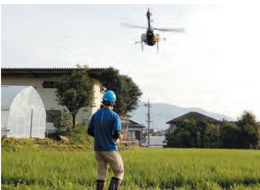
▲北郷地区でのカメムシ防除剤散布の様子

しかし、おやまのお米がおいしい、いちばんの理由は、何といても生産者の皆さんの真心こもった毎日の管理のおかげです。