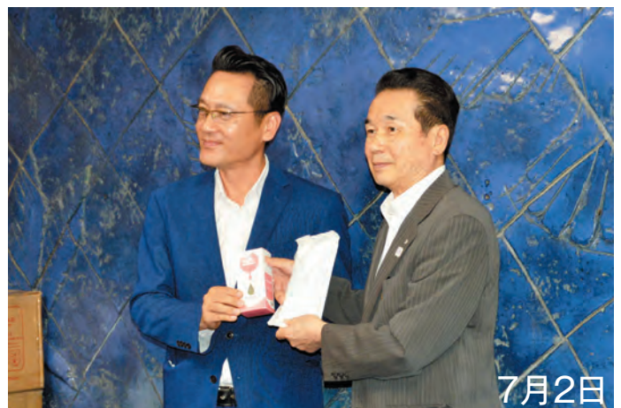
▲大都ホールディングス(株)からマスク5,000枚と抗菌スプレー72本の寄附を受けました