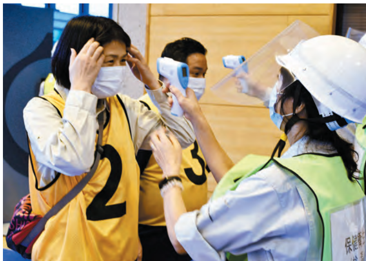
▲避難所での感染を防ぐために、消毒や検温を徹底します

検証は土砂災害警戒情報が発表され、避難勧告が発令された想定で行いました。参加した職員約40人は運営者と避難者となり、検温・手指消毒を実施し、間隔をとりながら誘導などをしました。発熱者を隔離する専用スペースや、飛沫感染防止のための段ボールの間仕切りなどを使用して「3密」を避ける方法を確認しました。