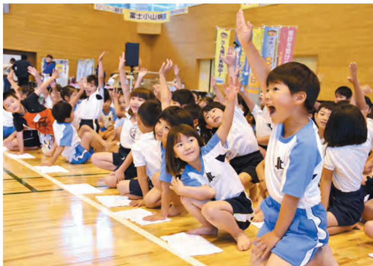
▲まもなくスタート! ぞうきんがけレース

町と小山町健康づくり推進協議会は6月15日、総合体育館でおやま健康フェスタを開催しました。これは金太郎のような元気で力強い健康なまちを目指す健康イベントで、14回目を迎えました。参加者は、赤ちゃんのはいはいグランプリや小学生によるぞうきんがけレース、趣向を凝らした関係団体のブースを家族で楽しみました。また、平成30年度特定健診受診率の高い地区の表彰式も行われ、小山2区が68.18%の受診率で1位となりました。