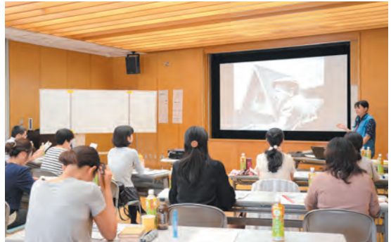
▲養成講座を受講中の参加者