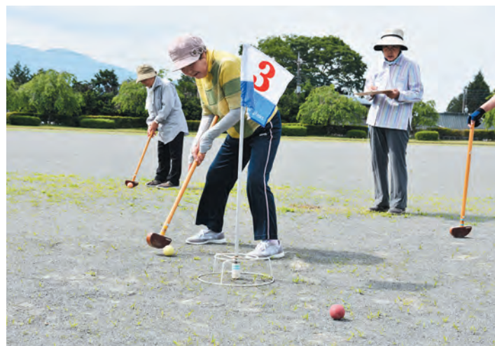
▲しっかり入れてね