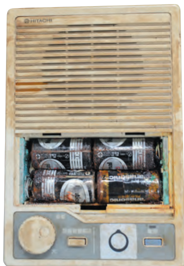
▲電池の腐食により故障した受信機

町から各家庭に貸与している戸別受信機。電波状況や老朽化などのさまざまな原因により、雑音がひどくなったり、放送が