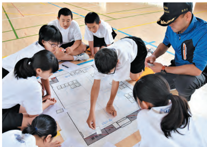
▲避難所運営ゲーム「HUG」を行う北郷中1年生

今後は、12月開催予定の地域防災訓練に参加してレポートを提出し、「ふじのくにジュニア防災士」の資格認定審査を受けます。また、2年生は三角巾を使った止血法、搬送法などの救急救命について、小山消防署員から学びました。