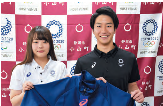
▲エンブレム入りのポロシャツとウインドブレーカーを製作。オリパラムードを高めています！