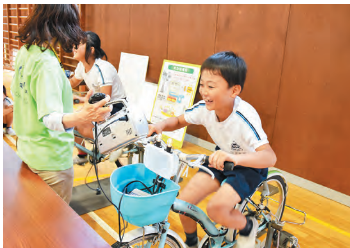
▲ついたー! 自転車発電をする明倫小4年生