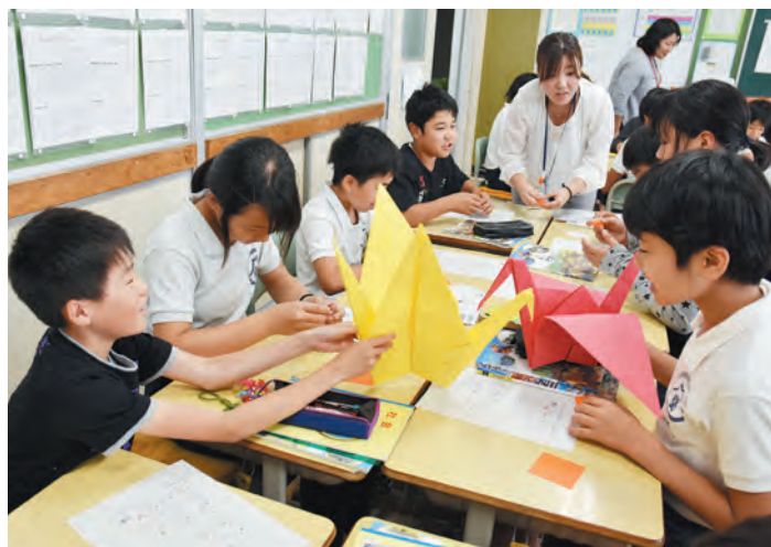
▲「大きい！」見本に折られた大きなツル

平和のつどいは、8月31日に総合文化会館で開催され、折り鶴は式典で献呈後、広島、長崎の平和公園に捧げられます。