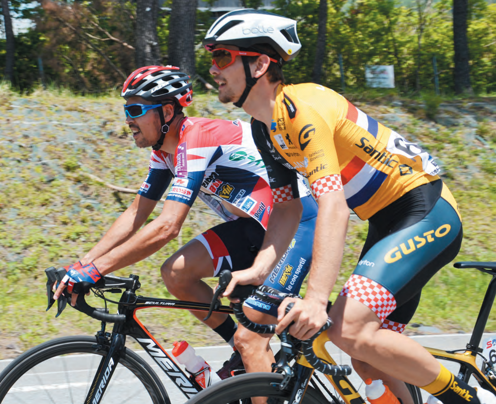
▲起伏に富んだ地形を持つ小山町。自転車レースが盛んに開催されています（TOJ 富士山ステージ 5月24日撮影）

東京2020オリンピック・パラリンピック開幕まで、あと1年余り。小山町では富士スピードウェイがオリンピックの自転車競技ロードレースのゴールとタイムトライアル、パラリンピックの自転車競技ロードレースの会場となります。