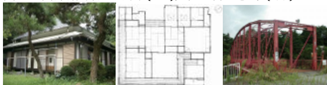
図 3 六合山荘外観と平面図（左）、森村橋（右）