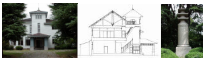
図 2 西洋館外観と断面（左）、和田君遺惠碑（右）

[ 註 ] 1) 『富士紡績百年史』上巻、富士紡績株式会社、平成 9 年。『静岡県の近代化遺産』静岡県教育委員会、2000。2) 註 1 に同じ。3) 調査は、財団法人都市計画協会の「まちづくり専門家派遣」制度を通じて、小山町都市整備課から山田が依頼を受けた。調査は 2004 年 9 月に実施し、小笠原徳明（神奈川大学日本常民文化研究所委託研究員）吉池美奈・野地保広（神奈川大学大学院工学研究科博士前期課程）が参加した（肩書きは当時）。4) 本稿の一部は以下で報告した。山田『静岡県駿東郡小山町 富士紡績関連施設 豊門会館（旧和田豊治家住宅）・豊門青年学校・六合山荘・森村橋など 建造物調査報告書』（2004 年 10 月）山田・西「大分県中津出身実業家 和田豊治の東京向島自邸、現駿河小山・豊門会館の調査研究」（日本建築学会九州支部研究報告第 44 号、2005 年 3 月）。5) 註 1 『富士紡績百年史』および、『小山町史』による。6) 『小山町史第五巻 近現代資料編』に収録。7) 『和田豊治伝』喜多貞吉編輯、和田豊治伝編纂所、1926。8) 富士紡績歴史資料「財団法人豊門会館設立許可申請」「財団法人豊門会館事業計画書」大正 12 年 5 月 7 日。9) 現在、運動場は小山中学校になり、児童遊園地には戦没者忠霊塔が建てられている。10) 富士紡績歴史資料「豊門会館寄贈樹木類調」大正 15 年。11) 「和田坂、大正十五年五月竣工」の石碑が嵌められている。12) 「豊門会館本館（旧和田豊治向島自邸）について 駿河小山、富士紡績の建築 その 2」2005 年度日本建築学会学術講演梗概集。13) 昭和 5 年 6 月 2 日に撮影された「天皇陛下静岡県へ行幸の御侍従子爵黒田長啓氏を小山工場に御差遣」と題する写真に、確認できる。14) 『和田豊治伝』に「規模の結構、装置の考案は美術界の大家朝倉文夫」とある。15) 軒下に海舟の落款をもつ扁額が掲げられていた。現在豊門会館本館に収蔵。16) 『小山町史』。17) 年代は橋脚プレートによる。設計者は秋元繁松、製作は株式会社東京石川島造船所。創業期に尽力した森村市左衛門を記念し、10 周年に合わせて第一・二工場入口に架橋された。現在、両工場はすでになく、富士紡績の創業の地を示す存在である。18) 六合山荘を除く。