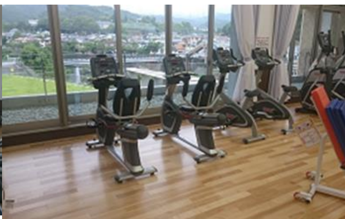
有酸素運動マシン（4種各2台）