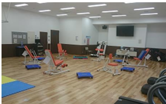
筋力運動マシン（6種6台）

疲れた体は、マッサージチェアや振動マシンでほぐして、リセット！ 誰もが気軽に、マシンを使って運動することで、体力回復、維持、向上が 図れます。いつもトレーナーが、あなたをお待ちしています。 週1回程度行われるリラクゼーションメニューの「ぷち講座(裏面)」は、 リラクゼーションスタジオの利用料金のみで参加できます。 予約も不要。運動するきっかけにしてはいかがでしょうか？