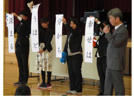
始業式で校長先生のお話

冬休みを終え、いよいよ3学期のスタートです。1月6日に降った雪がうっすら積もった道路や運動場を通りながら、子どもたちは元気に登校してきました。冬休み中、物音がしないさみしい学校だったのが、ぐんと活気づいてきました。