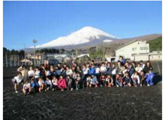
↑ 富士山の前で学年写真