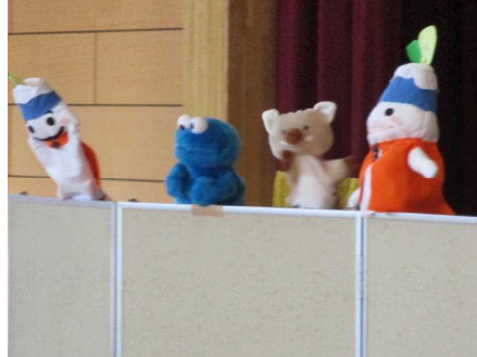
すばるくん一座 人形劇