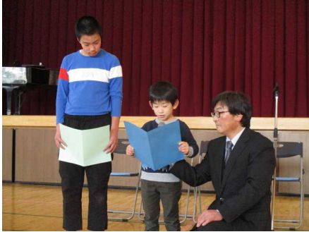
代表児童が新年の抱負発表