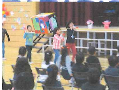
★入学式：2年生が元気よく学校生活を紹介。