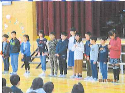
★始業式：21人の転入生が自己紹介しました。