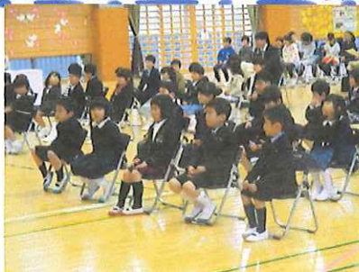
★入学式：ぴかぴかの1年生、ちょっぴり緊張？