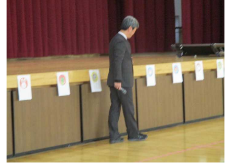
校長先生より干支のお話

授業再開日、澄み切った青空にくっきりと浮かび上がる富士山に見守られ、元気よく子どもたちが登校してきました。冬休みの間、天気も良く、どの子も充実した冬休みを過ごしたようです。何より、事故や大きな傷病がなかったのが幸いです。