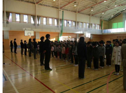
全校集会でごあいさつ