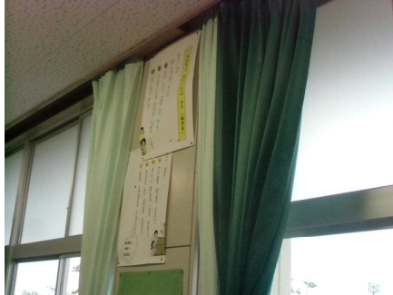
新しくなった教室・ 特別教室のカーテン

10月末には6年生の金管バンドのユニフォームが紹介させていただいたもの以外にも、彰徳山林会様より、学校のためのご支援を