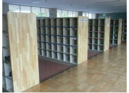
きれいになった 下駄箱の側面