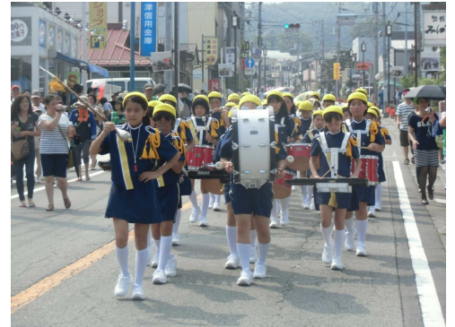
夏祭り6年生による金管パレード

夏休み、子どもたちが、大きな 涼事様が、スチ動をちうも みさな配慮が、見学校はと指導を のえく慮がい壇れあはり止支 前感過が、い壇れあはり止支 半じごあまにるるじ大め、支 はらせたのこのスな戻すし成 暑れたのこのスな戻すし成 いるのは、このスな戻すし成 日須は、このスな戻すし成 が走ると、このスな戻すし成 が続で、このスな戻すし成 きました。このスな戻すし成 ました。このスな戻すし成 8月も後半になり暑さも収まり 庭先にも、庭先にも、庭先にも