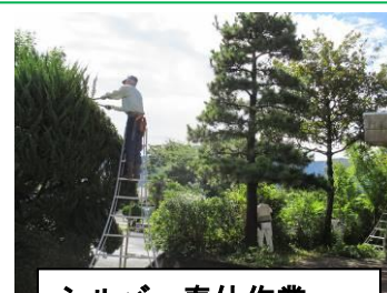
シルバー奉仕作業

夏休みの前半は暑い日が続きました。8月中旬は不安定な天候が続き、プールの開放も何回か中止しました。そして、夏休みの終盤、また熱い太陽が戻ってきました。この夏休み、子どもたちが、大きな事故もなく過ごせたのは、ご家庭や地域の皆様のご配慮があつてのことと思います。ありがとうございました。