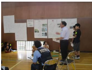
6年 交通安全リーダーと語る会