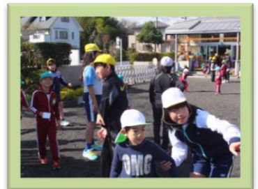
5年生こども園との交流