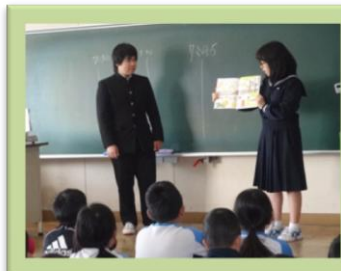
中学生の読み聞かせ

来週の14日には、北郷中の1年生が「よさこいソーラン」を踊りに来てくれます。「地域と家庭と学校で育てるきたごうの子」を目指して頑張っています。