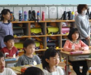
園幼保小交流研修会 5.12