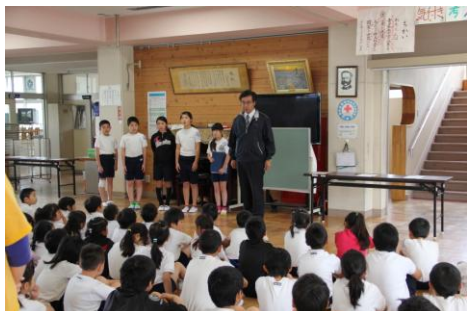
今年度の結団式の様子（4月30日）

子どもたちには、JRC活動を通し身近なところでできることがたくさんあることに気付いてほしいと願っています。