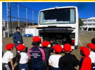
バスの乗り方教室 2年