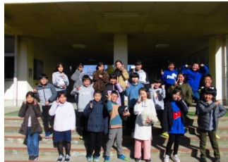
仁見先生頑張って 5年