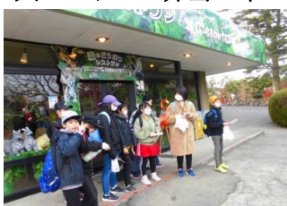
伊豆シャボテン公園 6年