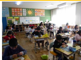
久しぶりのお弁当 3年