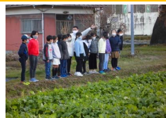
水かけ菜の成長 4年