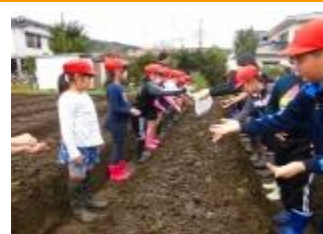
水かけ菜の種まき4年