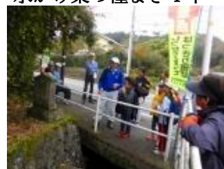
谷戸山ハイキング