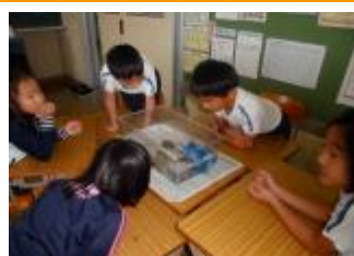
ザリガニの観察2年