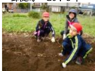
さつま芋ほり2・3組