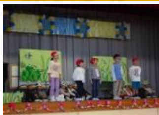
虫となかよし劇1年