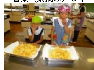
じゃがいも料理2・3組