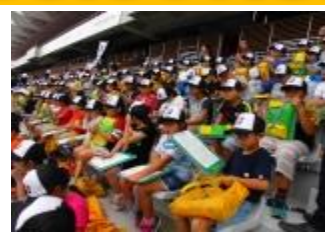
パラサイクル体験4年