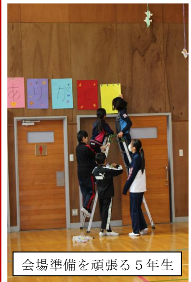
会場準備を頑張る5年生

2月27日に、卒業する6年生へ感謝の気持ちを伝える「スイートピー旅立ちの会」が行われました。5年生が企画、運営を担当し、当日は、各学年から心のこもった出し物やプレゼントが6年生に贈られました。6年生からもお礼として、在校生へのメッセージと、歌、合奏のプレゼントがありました。全校でのゲーム、懐かしい映像もあり、子どもたちの顔には終始、笑顔があふれていました。6年生の子どもたちの感慨深い表情が印象的でした。5年生の頑張り、6年生から在校生にしっかりとバトンが渡され、感謝の気持ちに包まれた、心温まる会となりました。