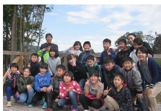
メガソーラー見学 4年