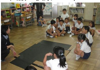
スイミーのマグロ 2年