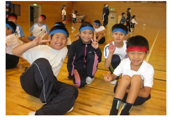
なかよし交流会 2・3組