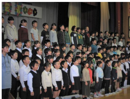
プログラムNo.7「全校合唱」より

また、PTA役員並びに保護者ボランティアの皆様には、事前の打ち合わせ、前日の準備、そして“明倫汁”の調理とたいへんお世話になりました。多くの皆様に学校や子どもたちが見守られていることを実感し、感謝の思いで一杯です。