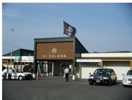
←旭山動物園 入り口

閉園寸前の動物園を、みごと経営を立て直したことで有名です。けれどもそこには、動物園職員の並々ならぬ努力と苦労があったのです。動物園の職員は、動物の生態については熟知しているものの、動物園の経営については素人同然です。そんな折、危機感を共有する職員全員で、行動展示へ向け取り組んだのです。初めは戸惑いもあったと思います。でも、何としても動物園を存続させるのだという強い願いが、従来の動物園の在り方とは異なる新しい価値観の創造で、閉園の危機を乗り切ったのです。