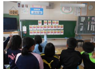
2/2 自分の鬼を退治しろ