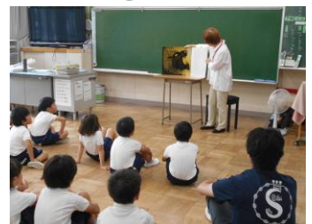
6.26 2年読み聞かせボランティア