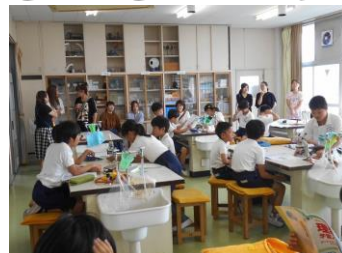
6.28 4年オープンスクール