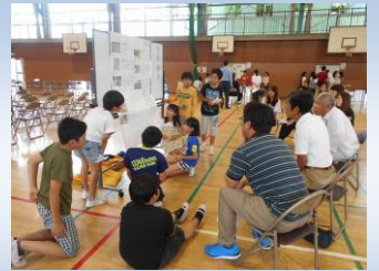
交通安全を語る会 5-6年