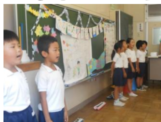
7.7 七夕なかまパーティー