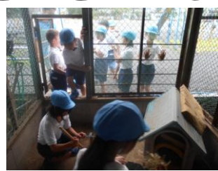
7.5 3年ウサギ当番復活!