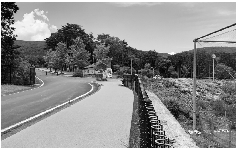
高地トレーニングに適している須走多目的広場