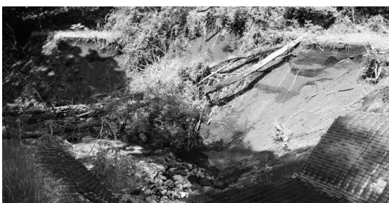
測量設計が行われる石沢排水