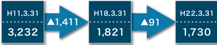
市町村数等の推移