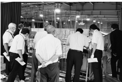
体育館に組まれたロケセットを見学