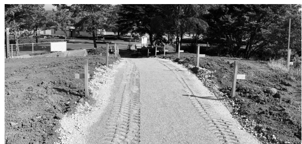
ジョギングコースが設置される多目的広場

多目的広場改修工事、足柄地区コミュニティセンター1改修工事、町道2415号線改良工事、町道2416号線他1路線道路改良工事の工事請負契約の締結を