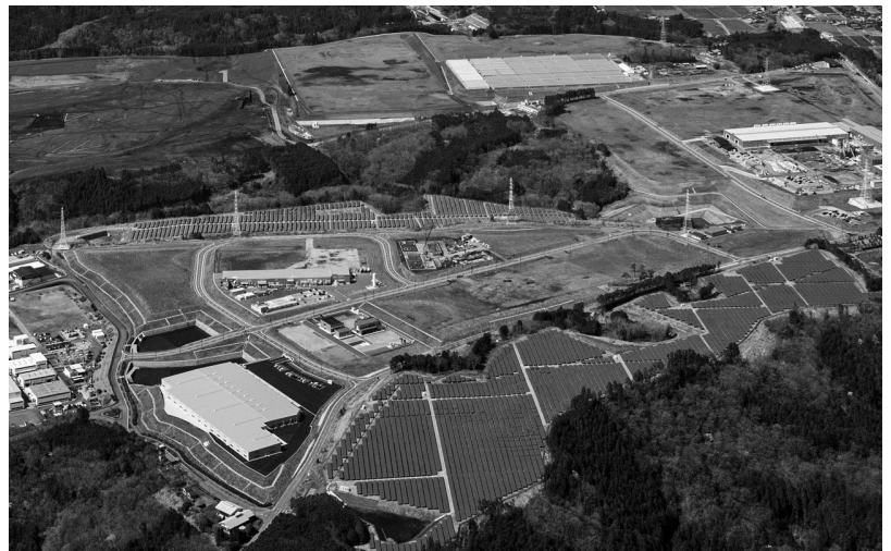
湯船原にある「DREAM Solar ふじおやま」