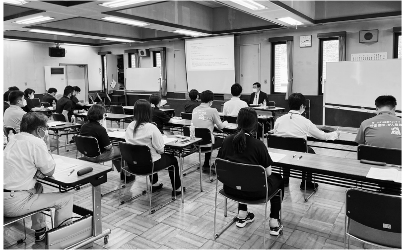
町では全職員向けにコンプライアンス研修を実施