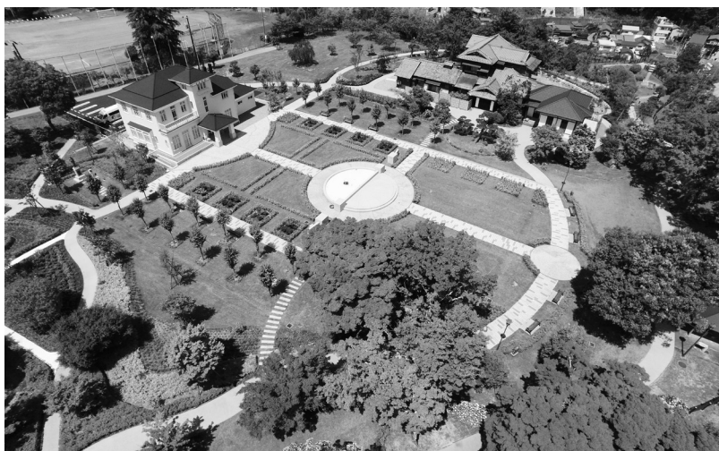
生涯学習課の所管となった豊門公園