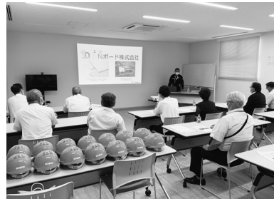
新たな企業「ENボード株式会社」