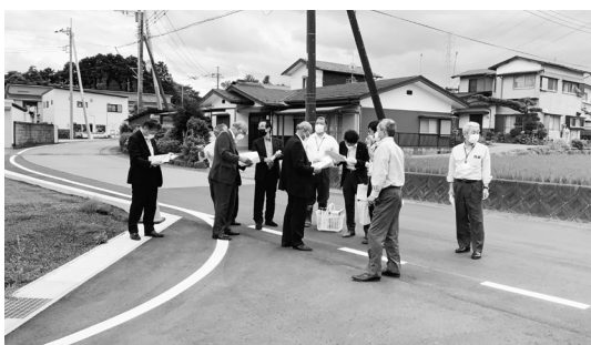
町道の認定及び変更箇所を確認

A 確かに数年前には施設整備に使用できる積立金は3億円以上ありましたが、現在では1億円程度に減っており、このままでは数年後に枯渇してしまう状況です。そのため、水道料金で利益を生み出し、積立金を増やしていくと、施設整備ができなくなるという状況なので、料金改定をお願いするものです。