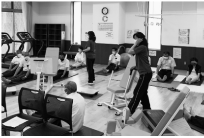
リラクゼーションスタジオを体験

町民の健康を維持増進していくために、適切なアドバイスのもとで運動できるこの様な施設の利用