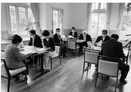
豊門公園の管理状況を確認

A パーティションについては、集団活動の中で、子ども同士の間隔が取れないとき等に、学校の判断で状況に応じて活用していくもので、10セットを購入する予定です。空気清浄機については、不足する分を1台購入するものです。