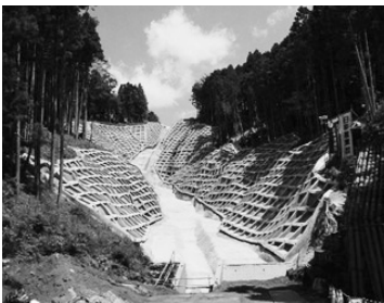
湯船排水路河川災害復旧事業