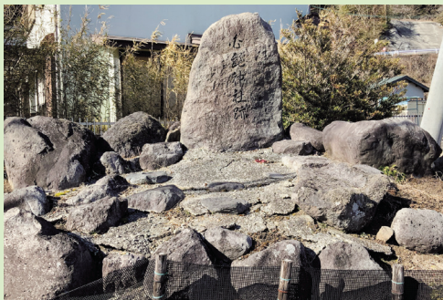
元円通寺が以前建っていた