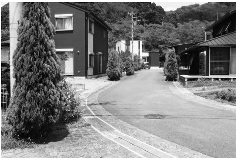
定住している南藤曲のクルドサック16