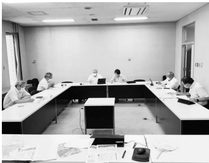
議会だよりの紙面を、委員会で確認中 (冷房故障中のため、窓を開けての作業)