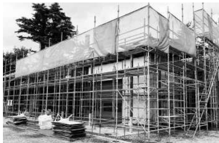
早期の復旧を目指して工事中

ドイツにあるブルクハルト社製の木質ペレットガス化熱電併給装置に関して、火災に伴う消火作業や降雨で水をかぶったことにより故障し、運転が不可能となったため、ガス化ユニットをすべて