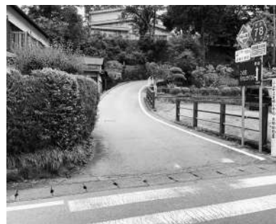
測量設計が行われる足柄小への道