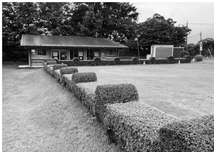
吉久保パークゴルフ場への安全な進入路はいつ完成