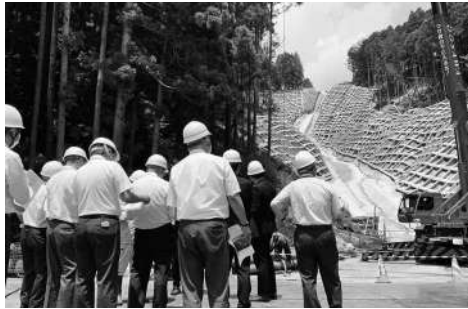
湯船排水路の状況を確認

は対象経費の2分の1以内で、上限800万円、増改築や改修等の場合は対象経費の3分の1以内で上限300万円です。