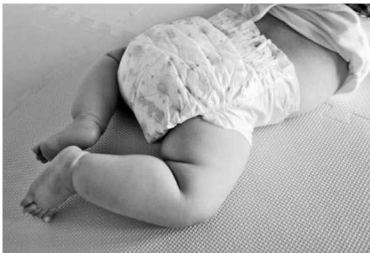
オムツの持ち帰りについて