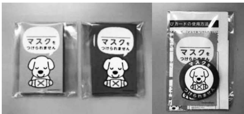
千葉県松戸市で配布しているカードとバッジ