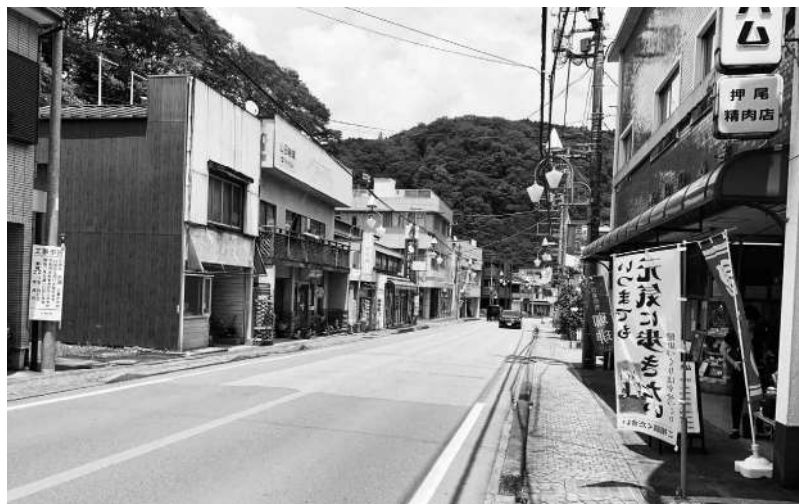
商店街の活性化は