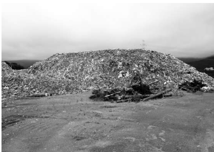
新産業集積エリアで掘り出された埋設廃棄物