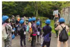
緑の少年団活動を支援