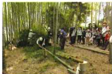
県民参加の森づくりを促進