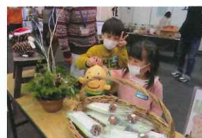
緑の募金活動のようす