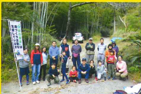
森づくり活動の支援