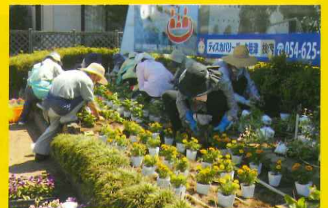
身近な環境緑化を促進