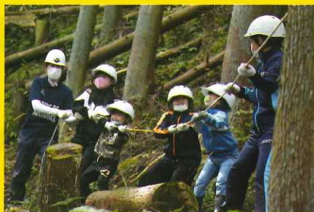
学校林の活用を支援