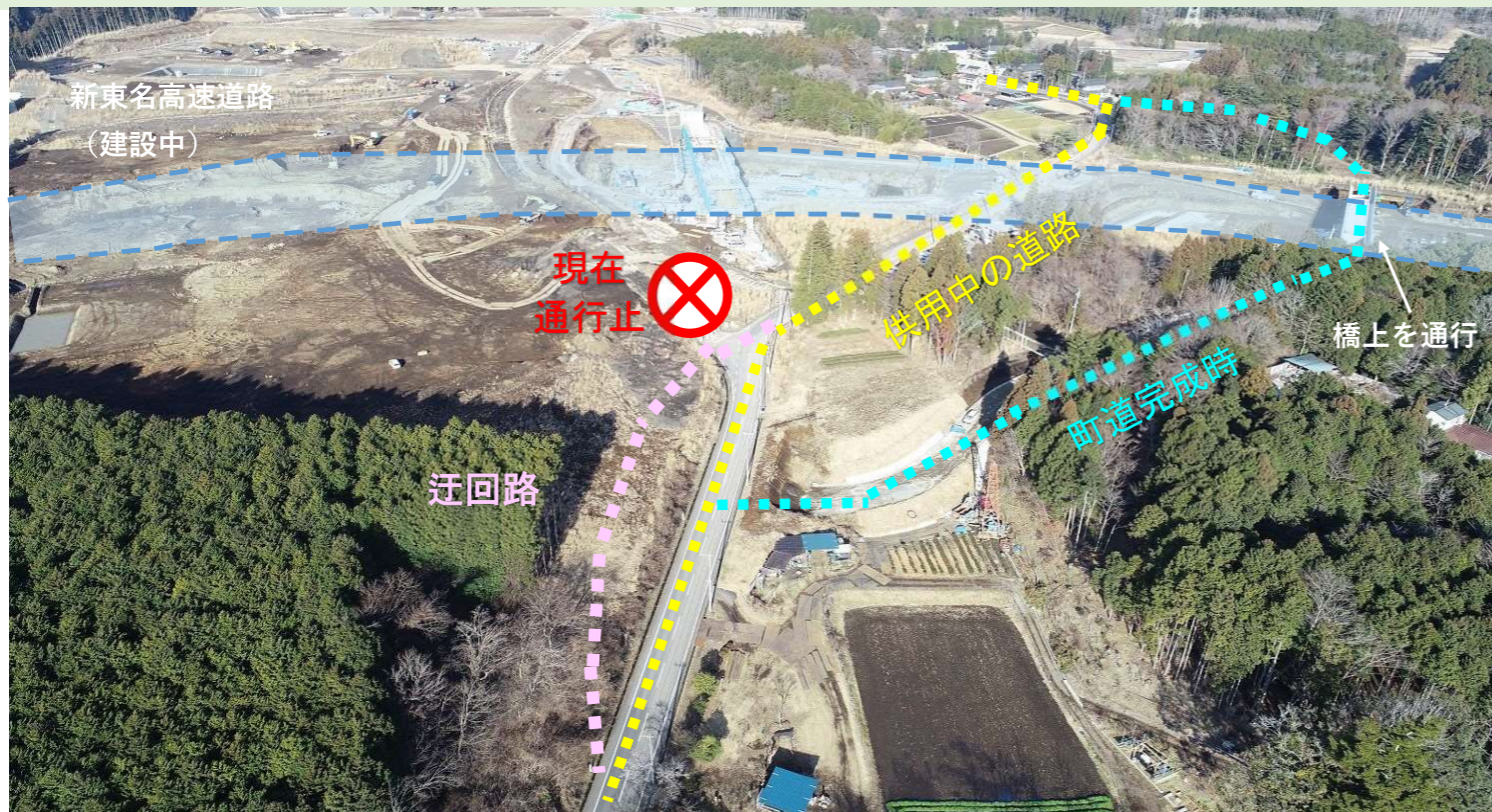
図1 切替後の道路（航空写真）

【 迂回期間 】 令和 5年 6月 27日 (火) ～ 令和 5年 11月 末頃 予定