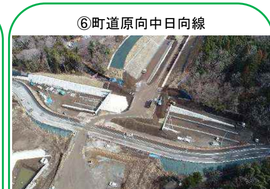
⑥ 町道原向中日向線