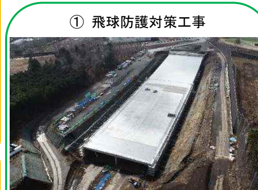
① 飛球防護対策工事