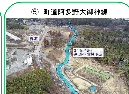
⑤ 町道阿多野大御神線