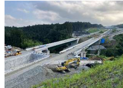
②上野川橋～名古屋側