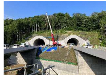
①西側トンネル坑口