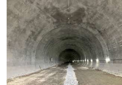
③下り線トンネル坑内